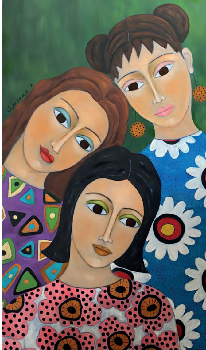
İsimsiz Tuval Üzeri Yağlı Boya, 110x65 cm