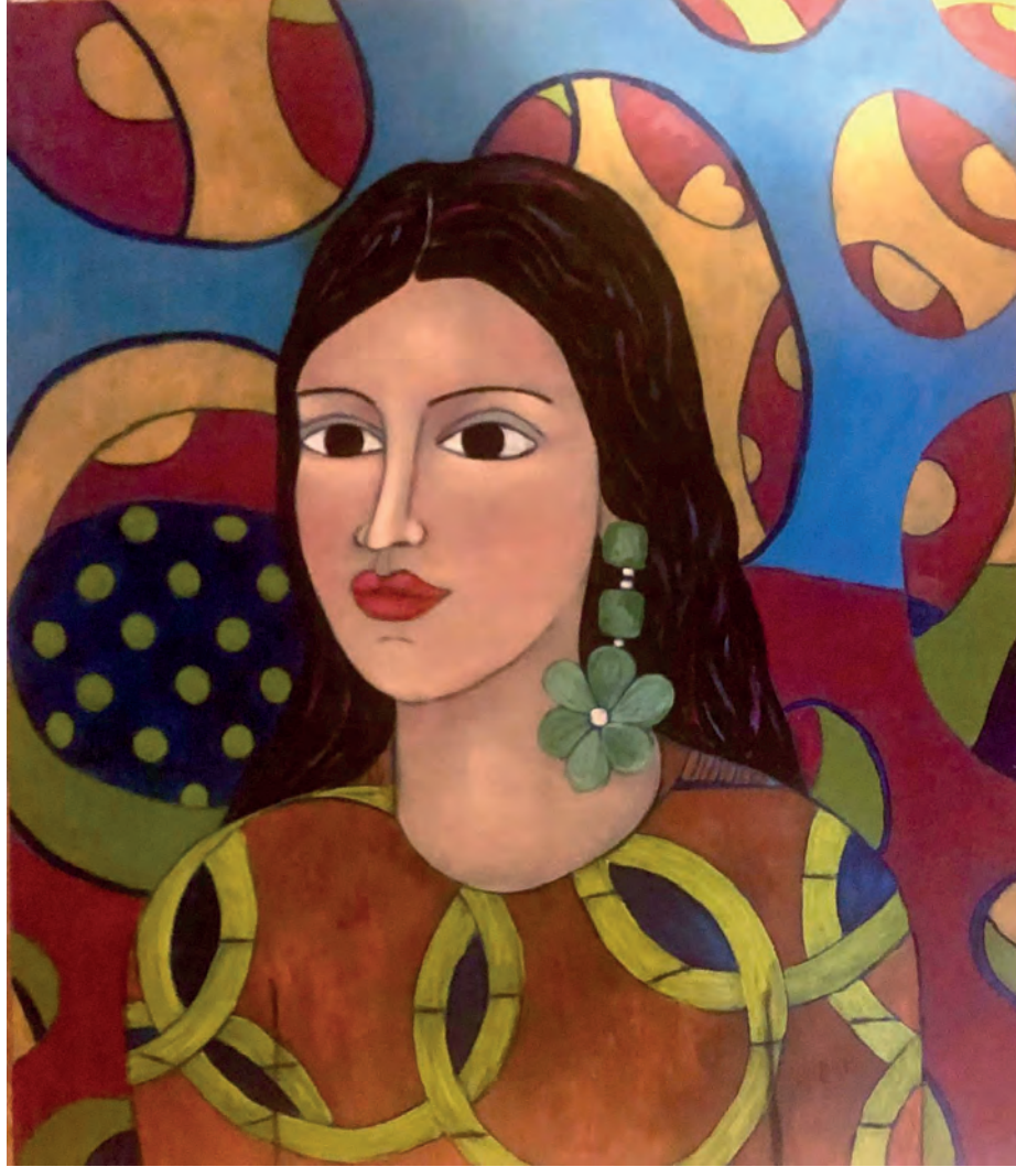
İsimsiz Tuval Üzeri Yağlı Boya, 70x60 cm