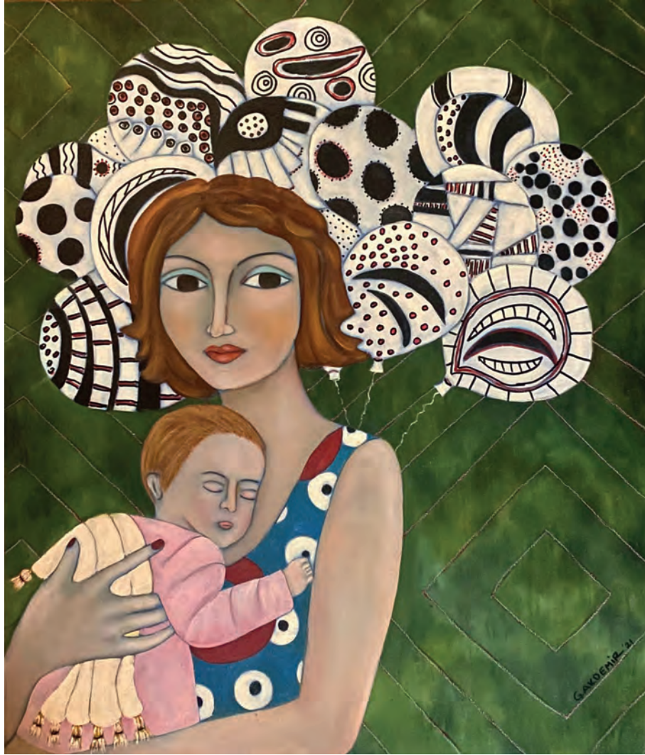
İsimsiz Tuval Üzeri Yağlı Boya, 70x60 cm