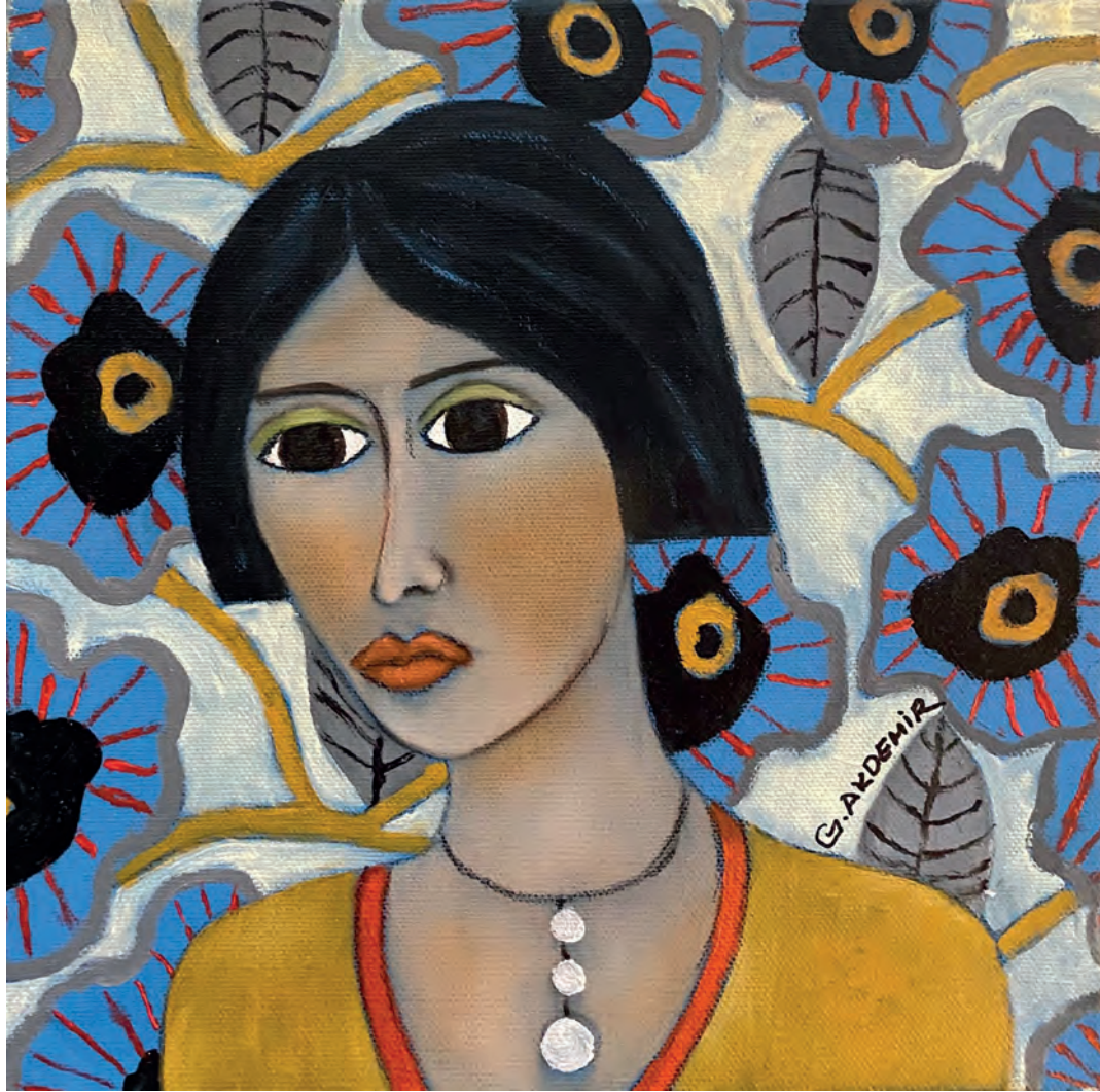
İsimsiz Tuval Üzeri Yağlı Boya, 20x20 cm