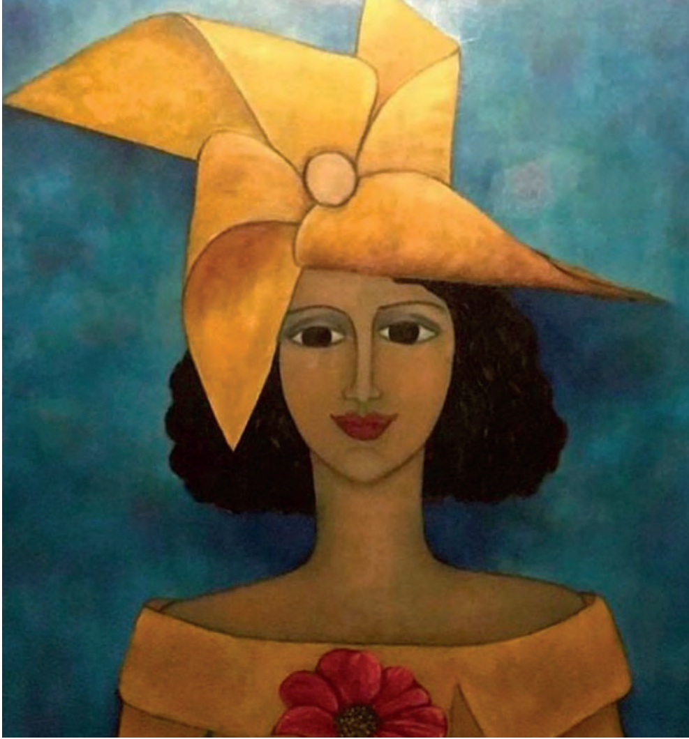
İsimsiz Tuval Üzeri Yağlı Boya, 70x60 cm