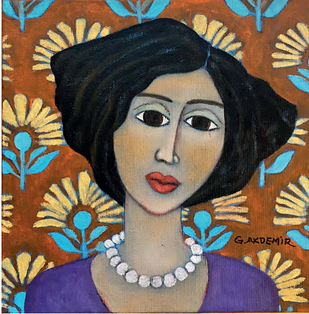
İsimsiz Tuval Üzeri Yağlı Boya, 20x20 cm