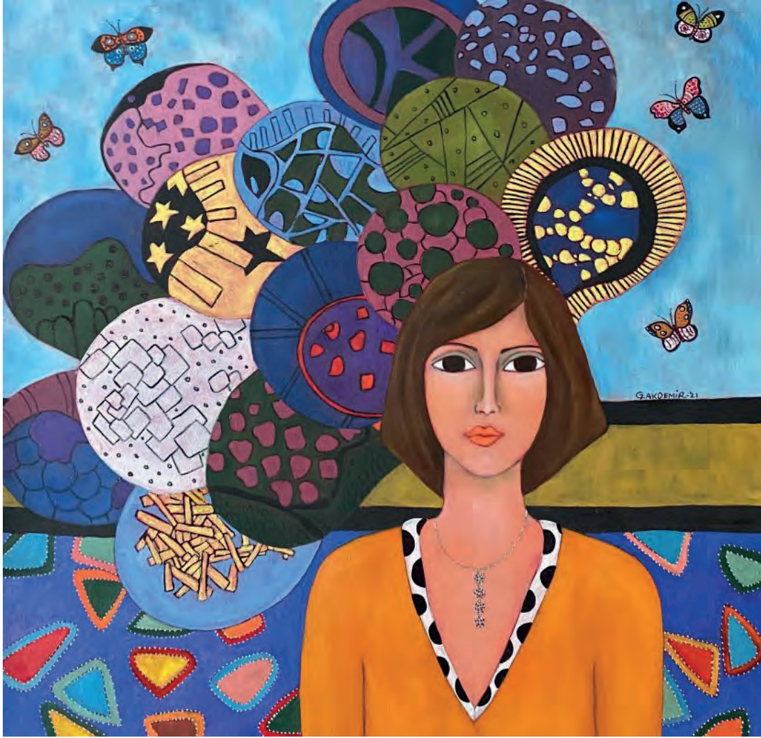
İsimsiz Tuval Üzeri Yağlı Boya, 70x70 cm