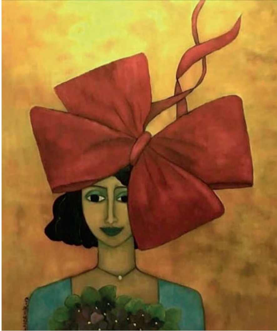
İsimsiz Tuval Üzeri Yağlı Boya, 70x60 cm