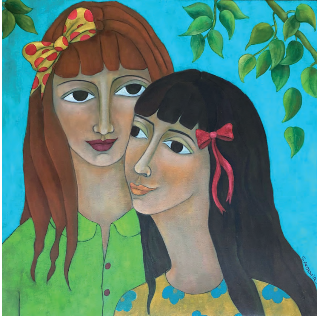
İsimsiz Tuval Üzeri Yağlı Boya, 66x66 cm