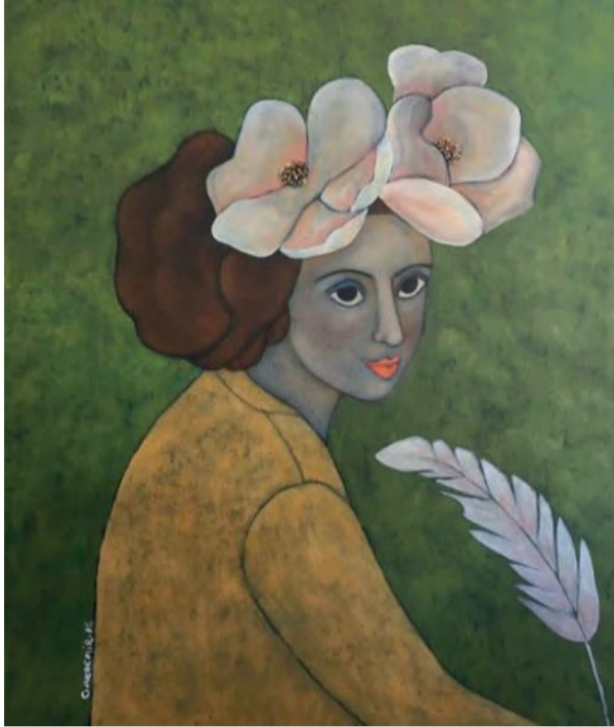
İsimsiz Tuval Üzeri Yağlı Boya, 70x60 cm