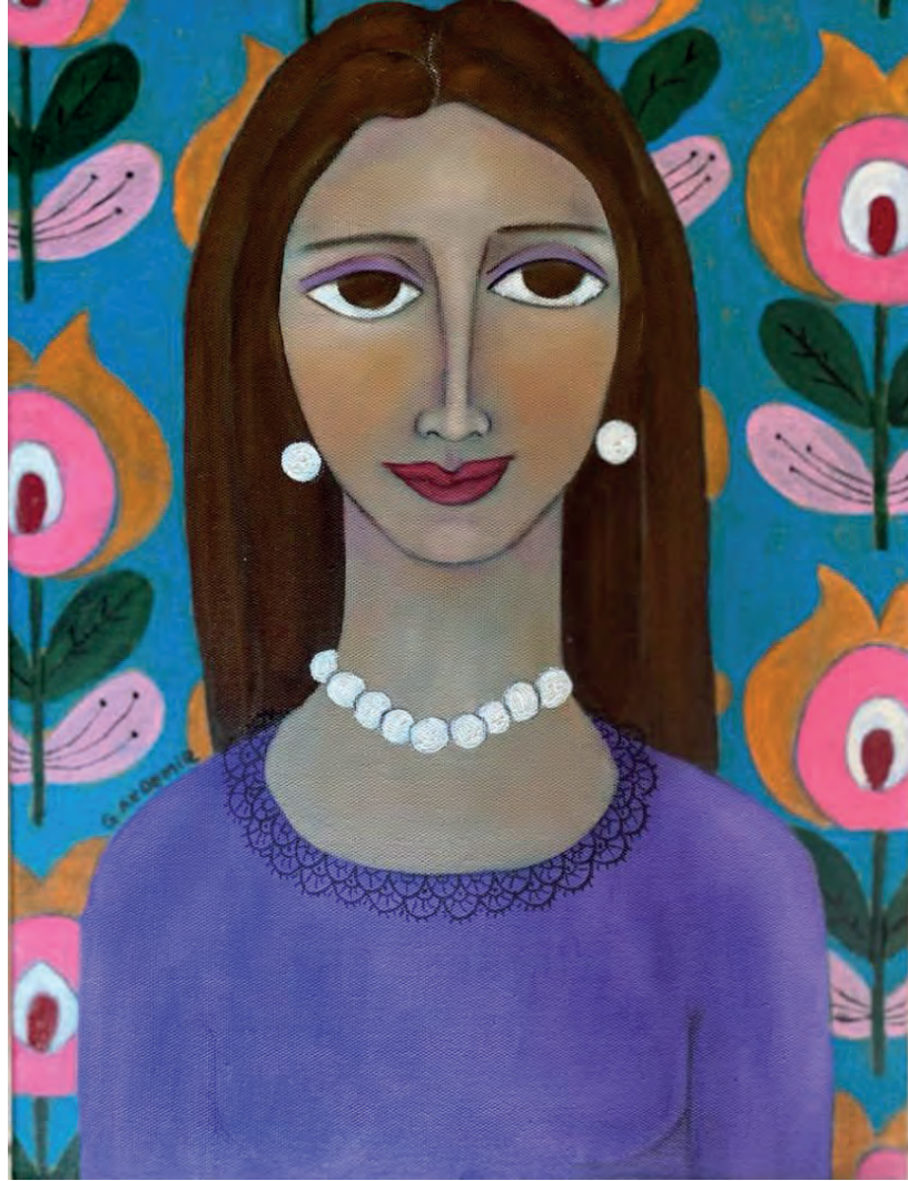
İsimsiz Tuval Üzeri Yağlı Boya, 40x30 cm