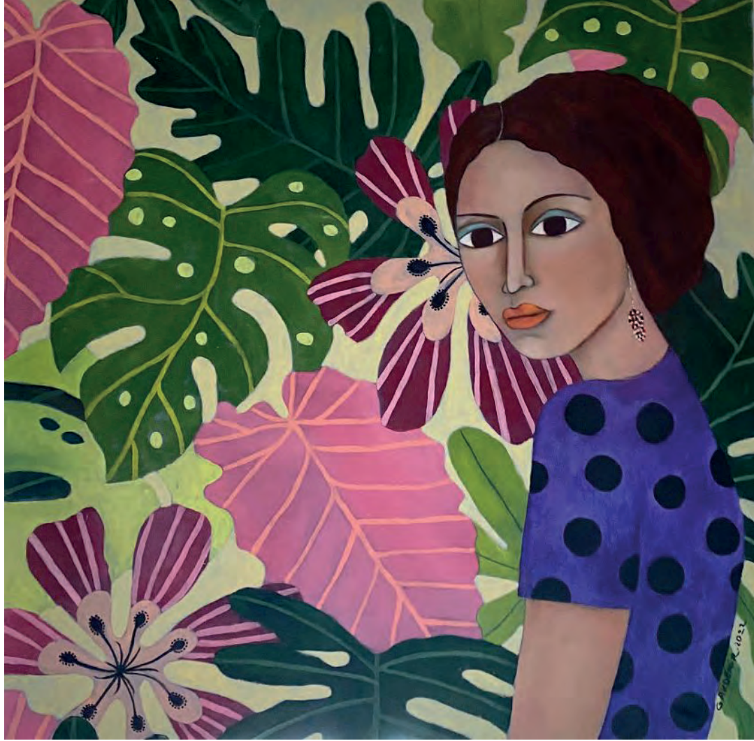
İsimsiz Tuval Üzeri Yağlı Boya, 70x70 cm