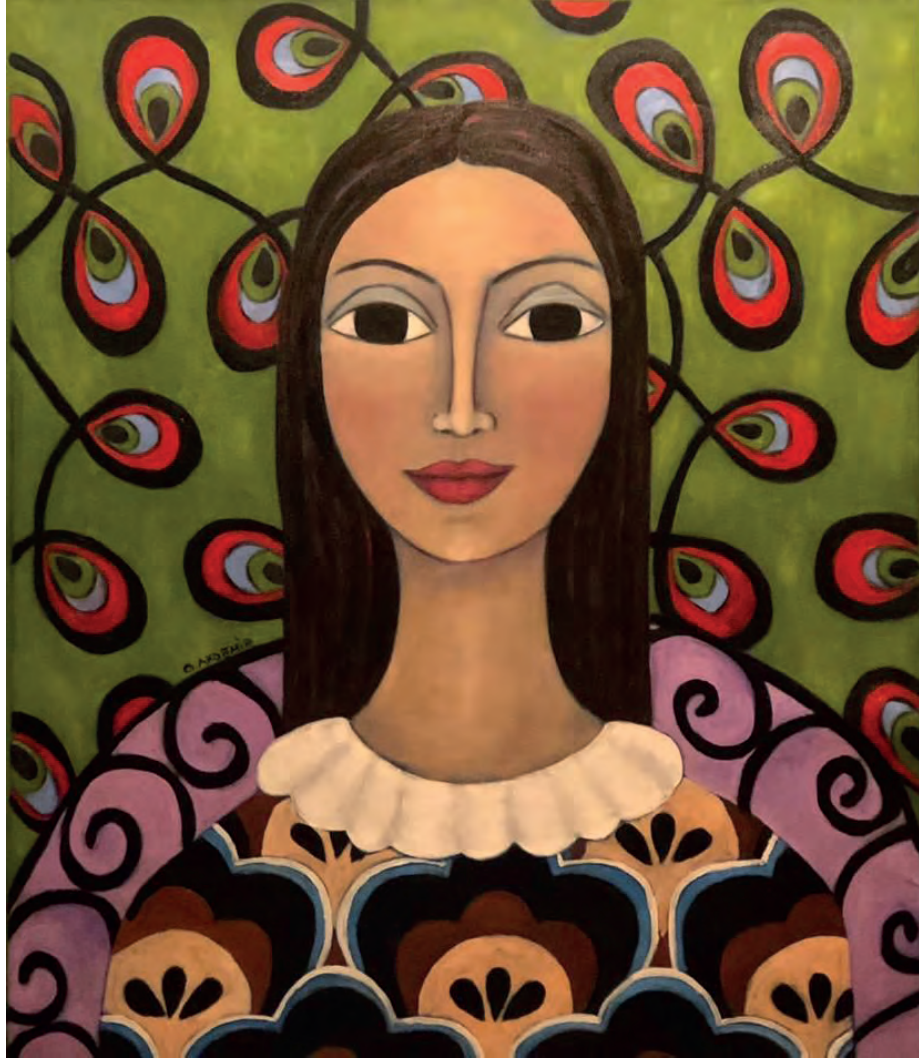
İsimsiz Tuval Üzeri Yağlı Boya, 70x60 cm