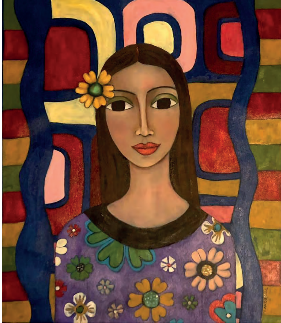
İsimsiz Tuval Üzeri Yağlı Boya, 70x60 cm