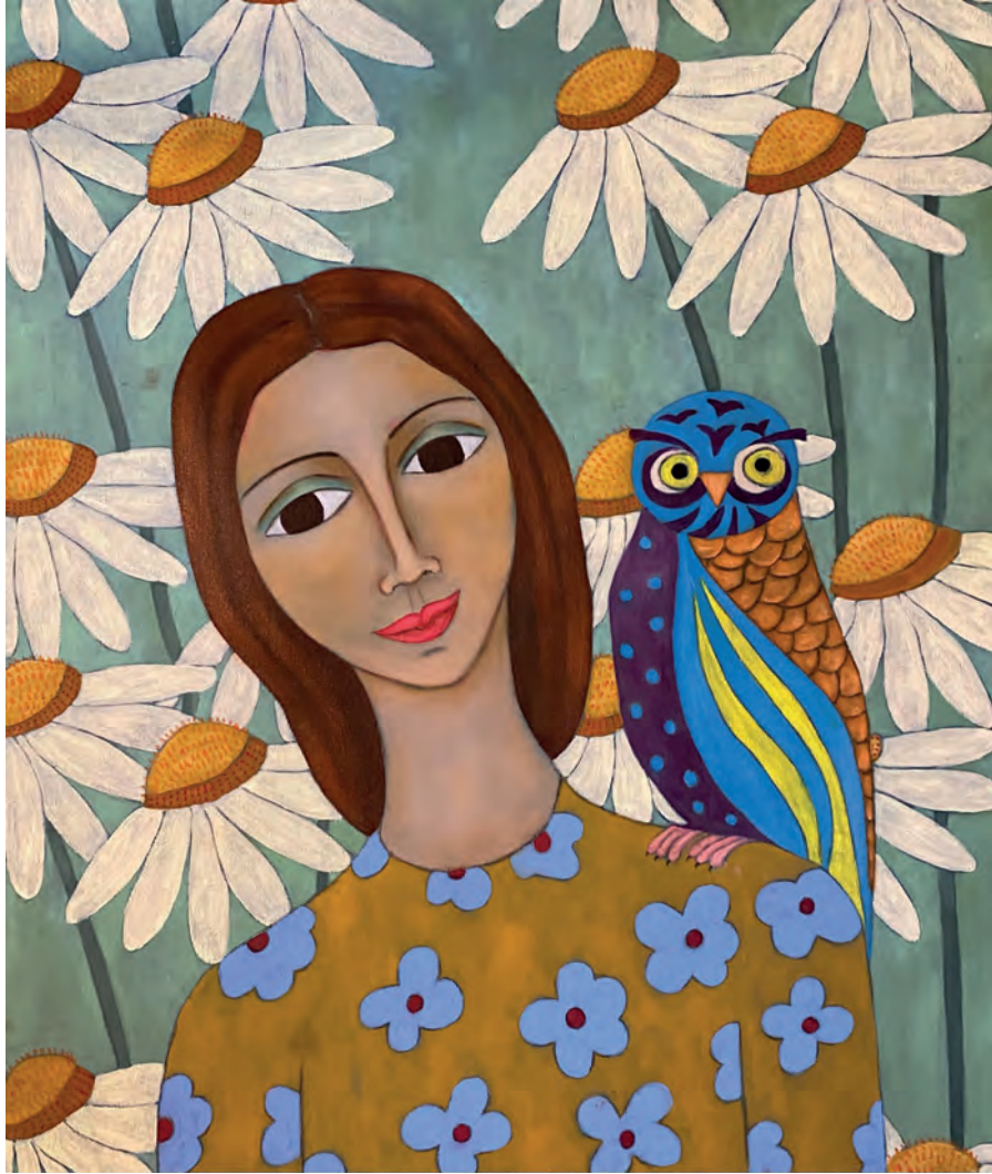
İsimsiz Tuval Üzeri Yağlı Boya, 70x60 cm