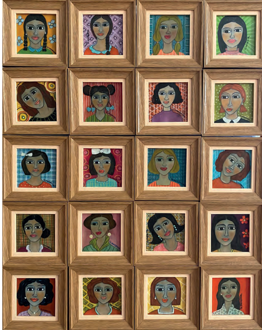
İsimsiz Tuval Üzeri Yağlı Boya, 10x10 cm