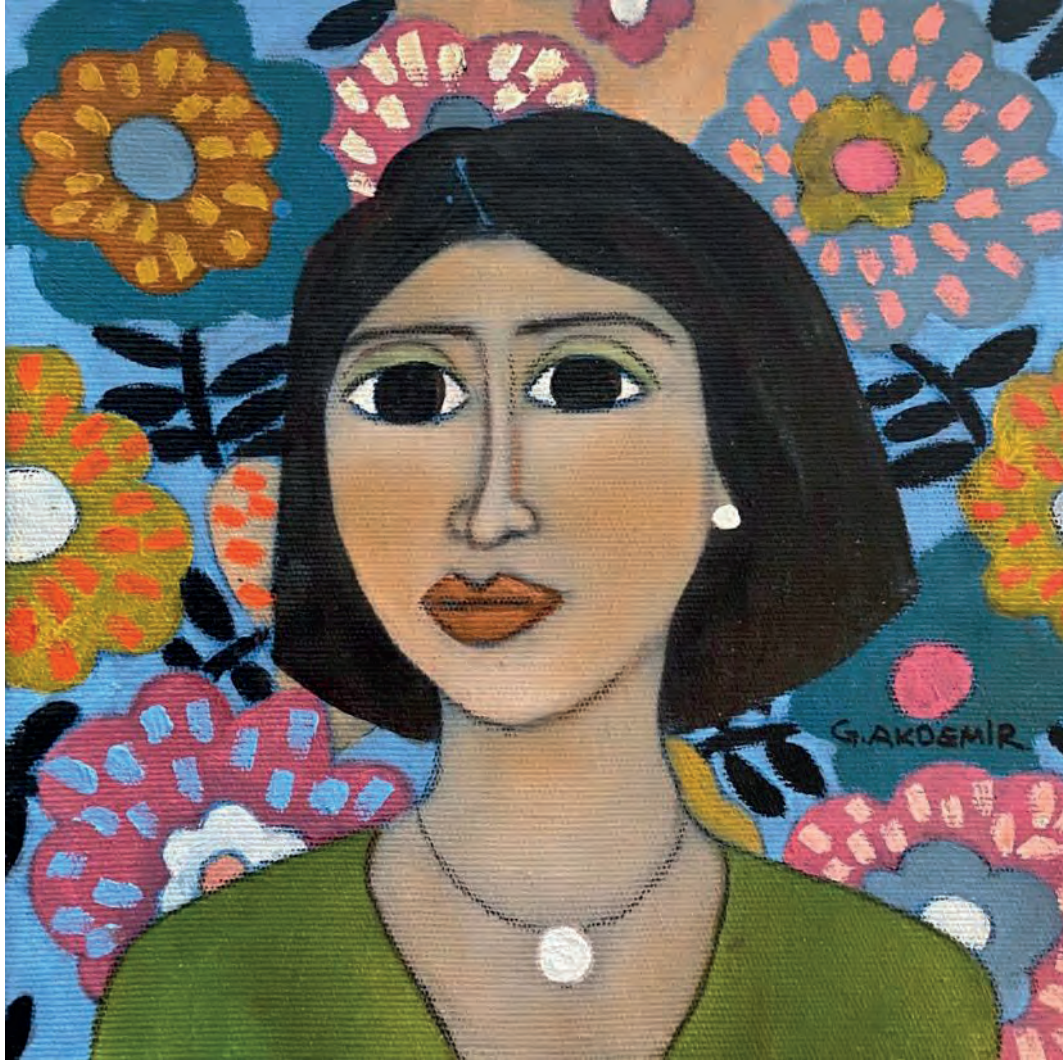
İsimsiz Tuval Üzeri Yağlı Boya, 20x20 cm