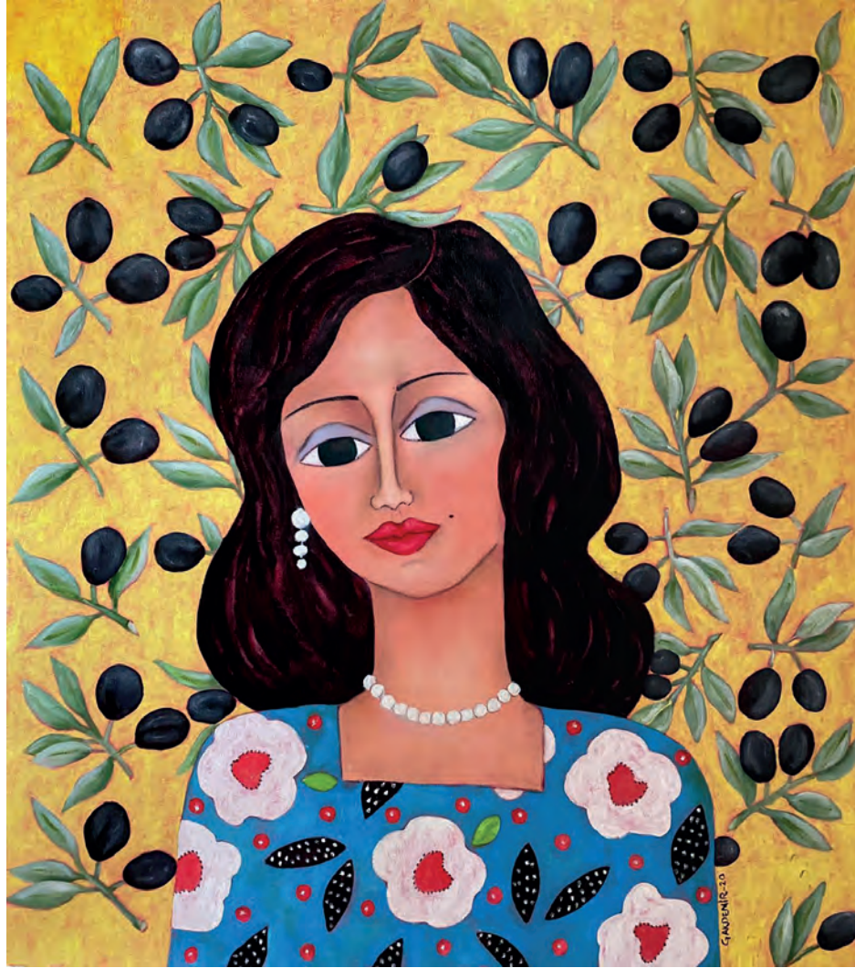
İsimsiz Tuval Üzeri Yağlı Boya, 70x60 cm