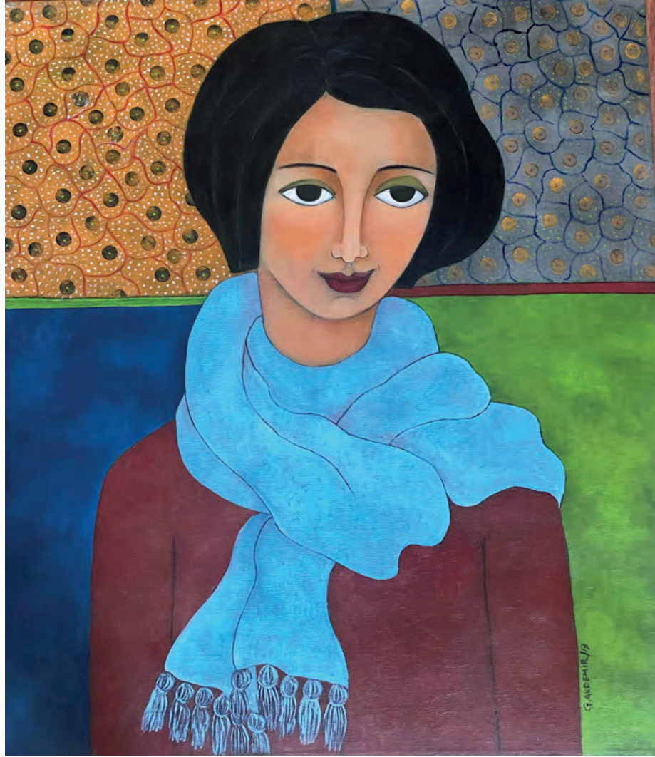
İsimsiz Tuval Üzeri Yağlı Boya, 70x60 cm