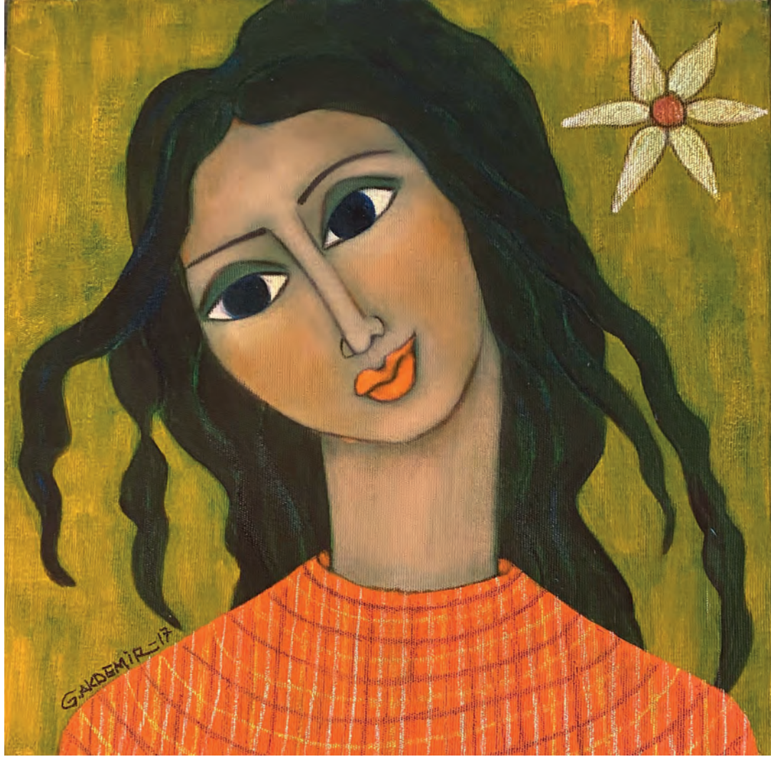
İsimsiz Tuval Üzeri Yağlı Boya, 35x35 cm