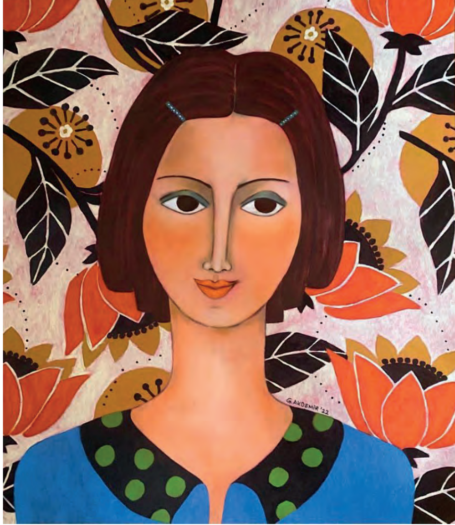
İsimsiz Tuval Üzeri Yağlı Boya, 70x60 cm