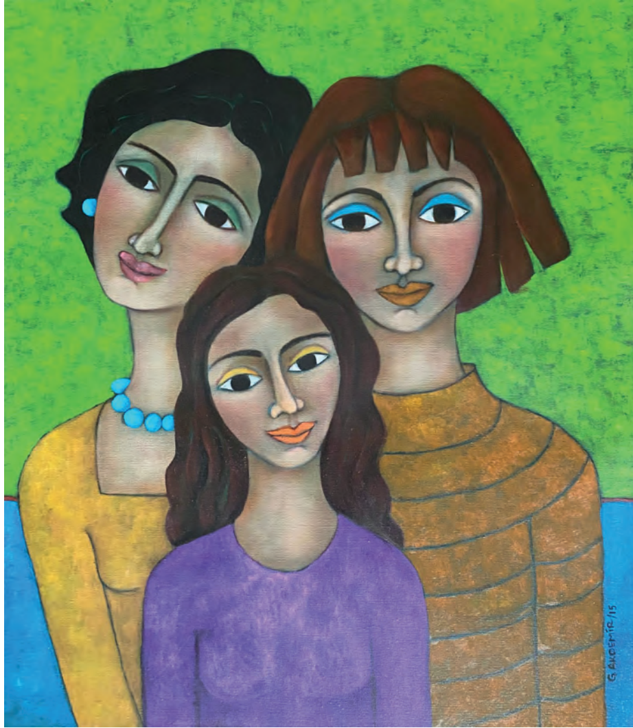
İsimsiz Tuval Üzeri Yağlı Boya, 70x60 cm