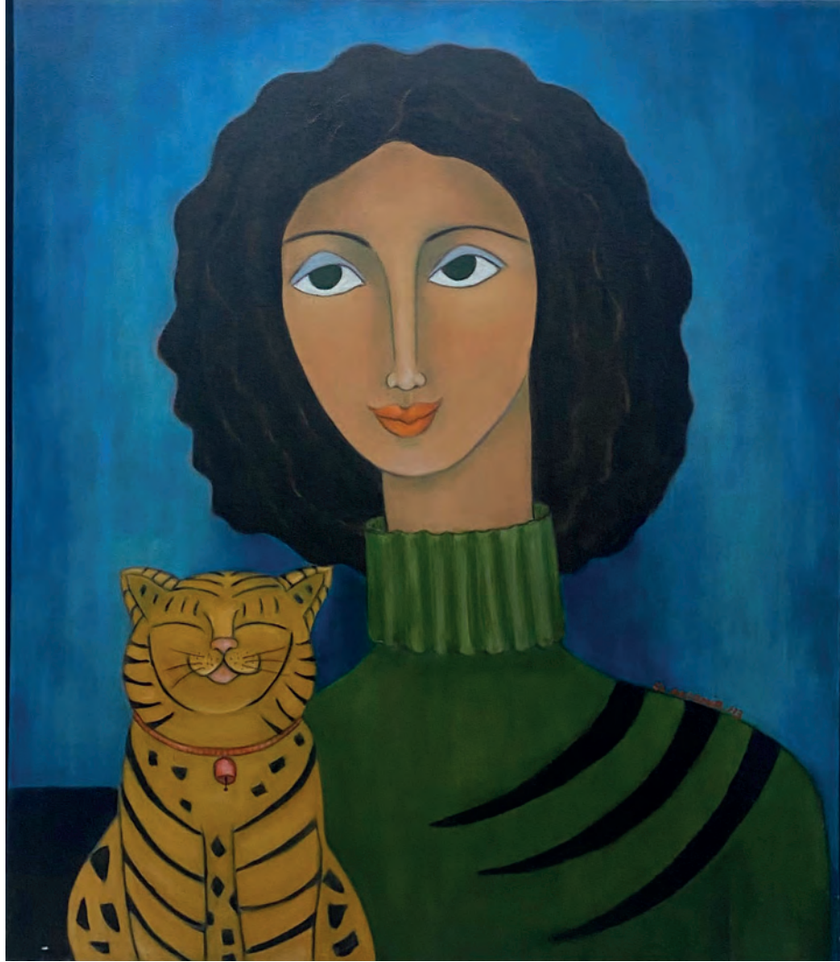
İsimsiz Tuval Üzeri Yağlı Boya, 70x60 cm