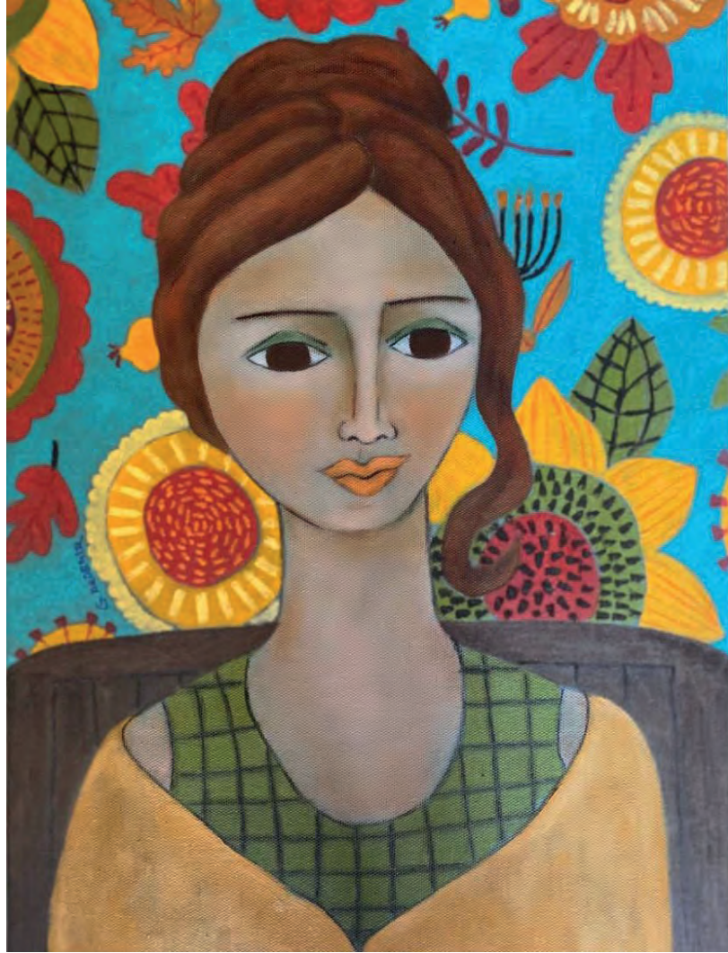
İsimsiz Tuval Üzeri Yağlı Boya, 40x30 cm