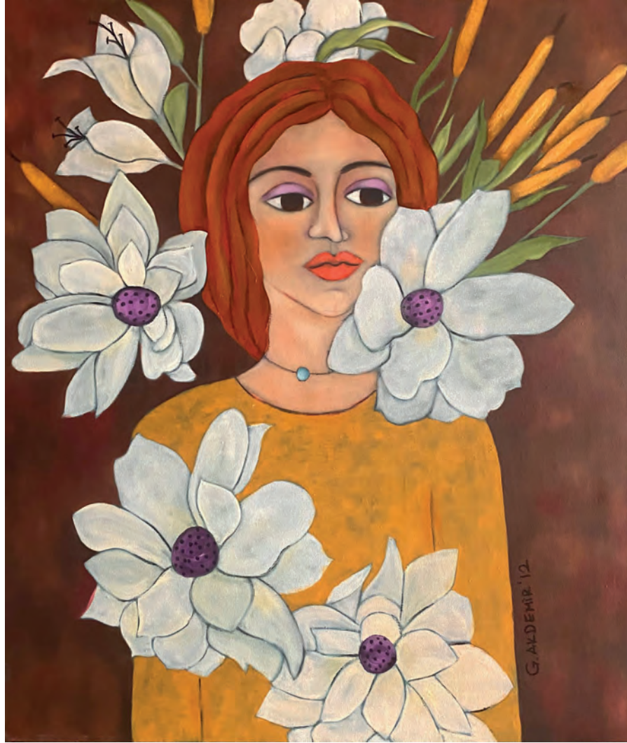
İsimsiz Tuval Üzeri Yağlı Boya, 70x60 cm