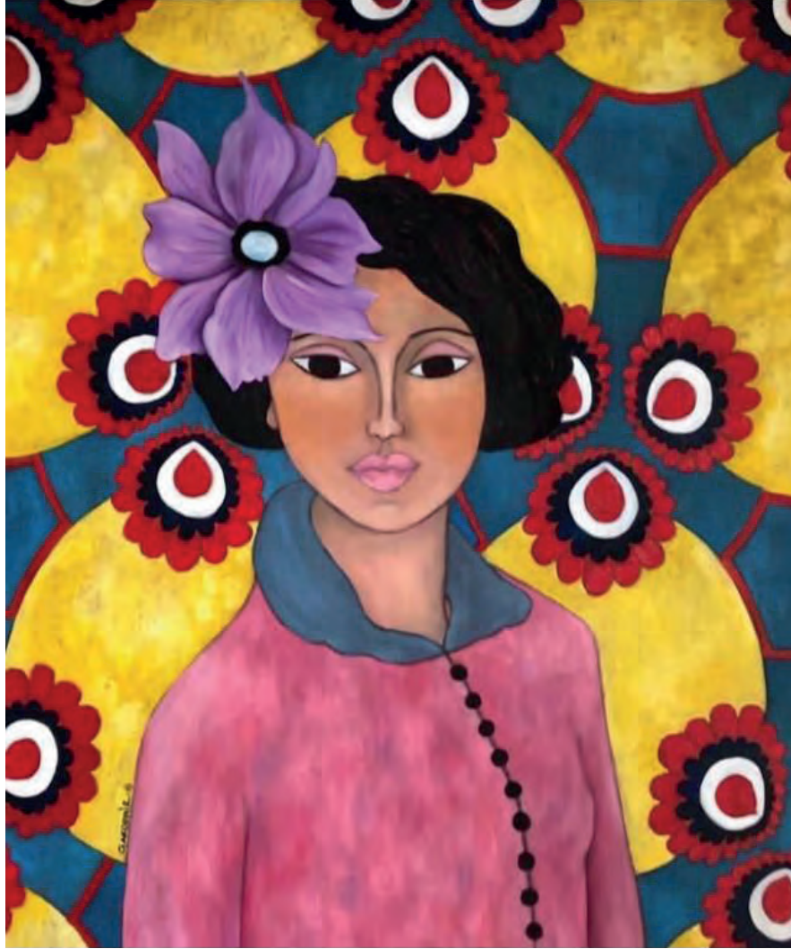
İsimsiz Tuval Üzeri Yağlı Boya, 70x60 cm