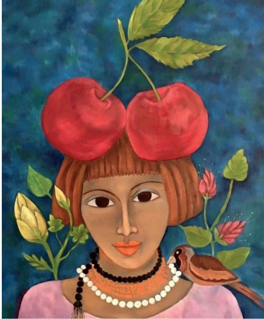
İsimsiz Tuval Üzeri Yağlı Boya, 70x60 cm