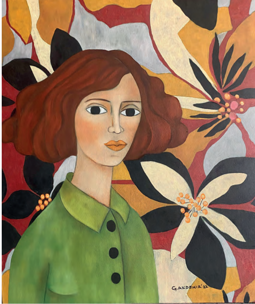
İsimsiz Tuval Üzeri Yağlı Boya, 70x60 cm