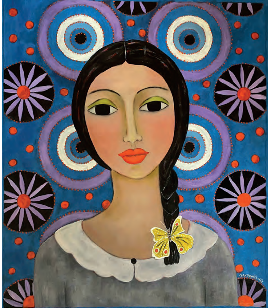
İsimsiz Tuval Üzeri Yağlı Boya, 70x60 cm