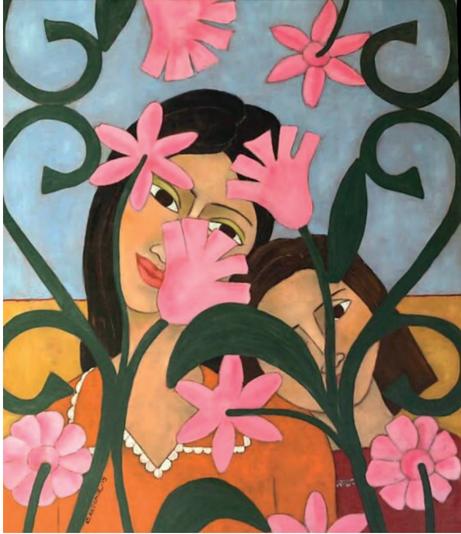
İsimsiz Tuval Üzeri Yağlı Boya, 70x60 cm