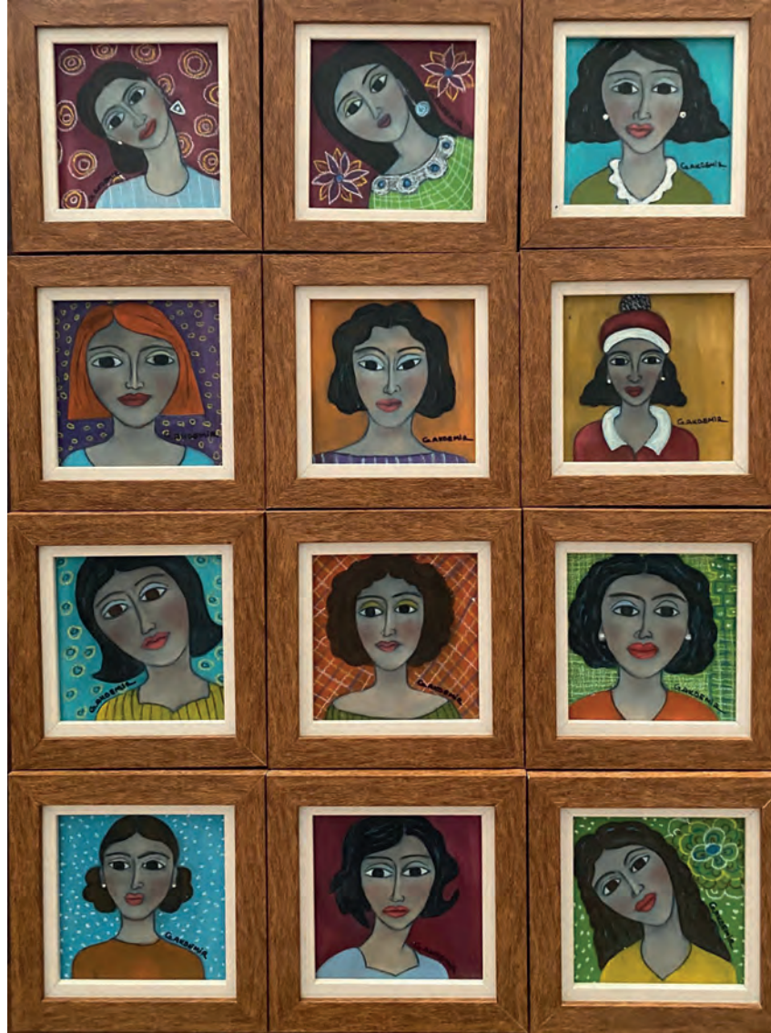
İsimsiz Tuval Üzeri Yağlı Boya, 11x11 cm