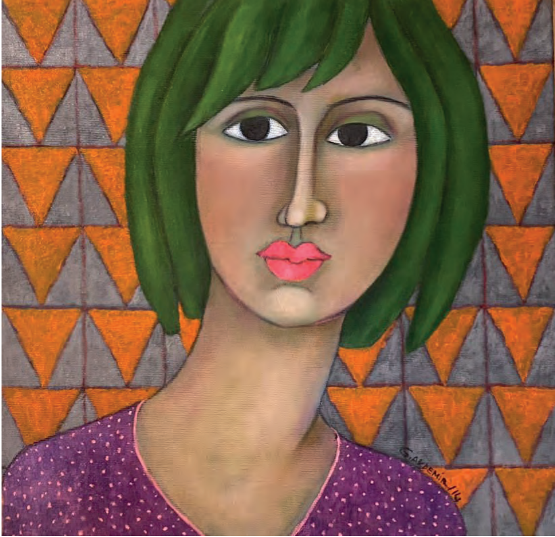
İsimsiz Tuval Üzeri Yağlı Boya, 35x35 cm