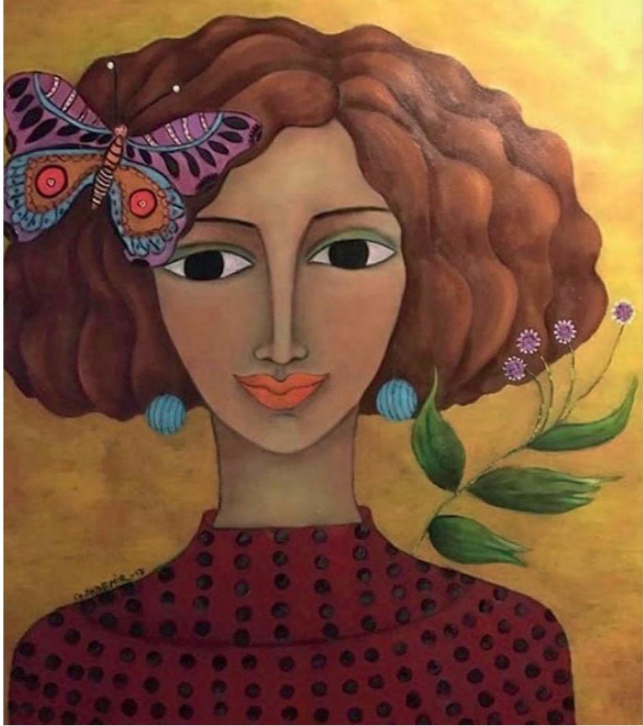
İsimsiz Tuval Üzeri Yağlı Boya, 70x60 cm