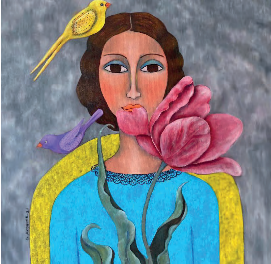
İsimsiz Tuval Üzeri Yağlı Boya, 70x70 cm