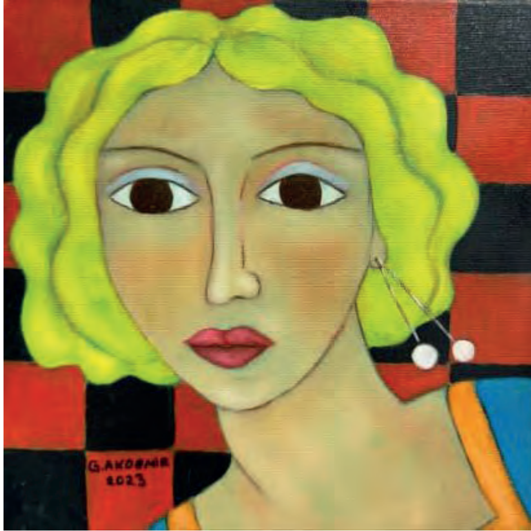
İsimsiz Tuval Üzeri Yağlı Boya, 25x25 cm