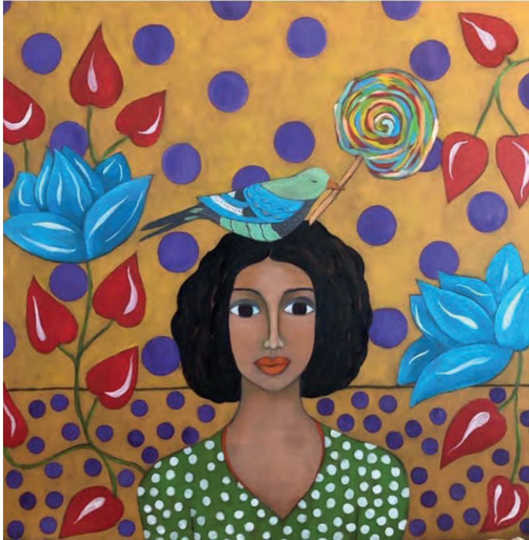
İsimsiz Tuval Üzeri Yağlı Boya, 70x70 cm