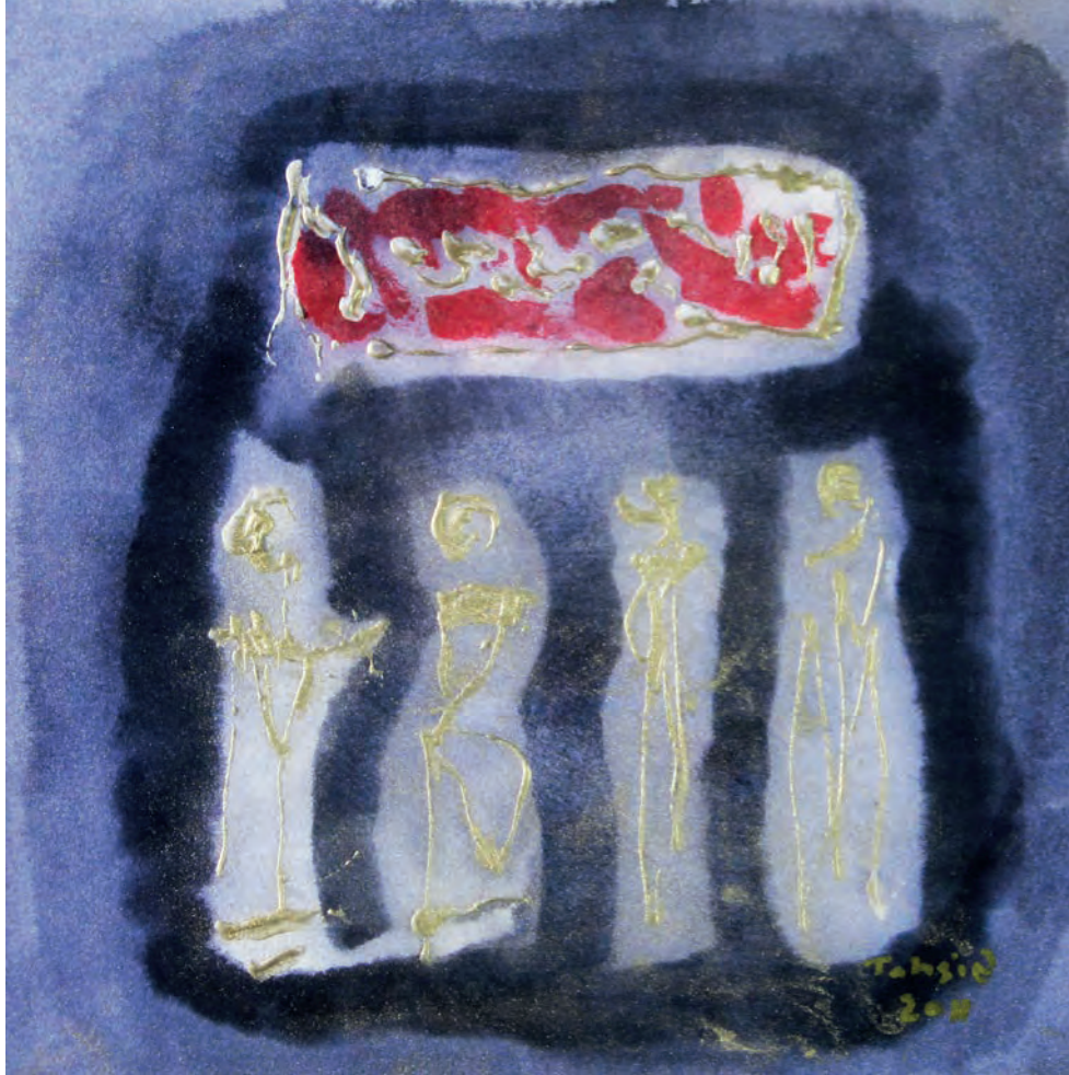
Duvar Yazısı Kağıt Üzeri Karışık Teknik, 25x25 cm, 2011