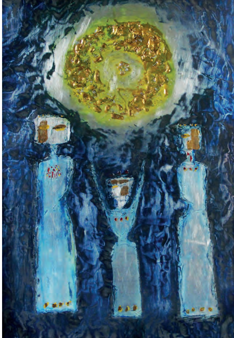
Üç Güzel Metal Üzeri Karışık Teknik, 50x70 cm, 2010