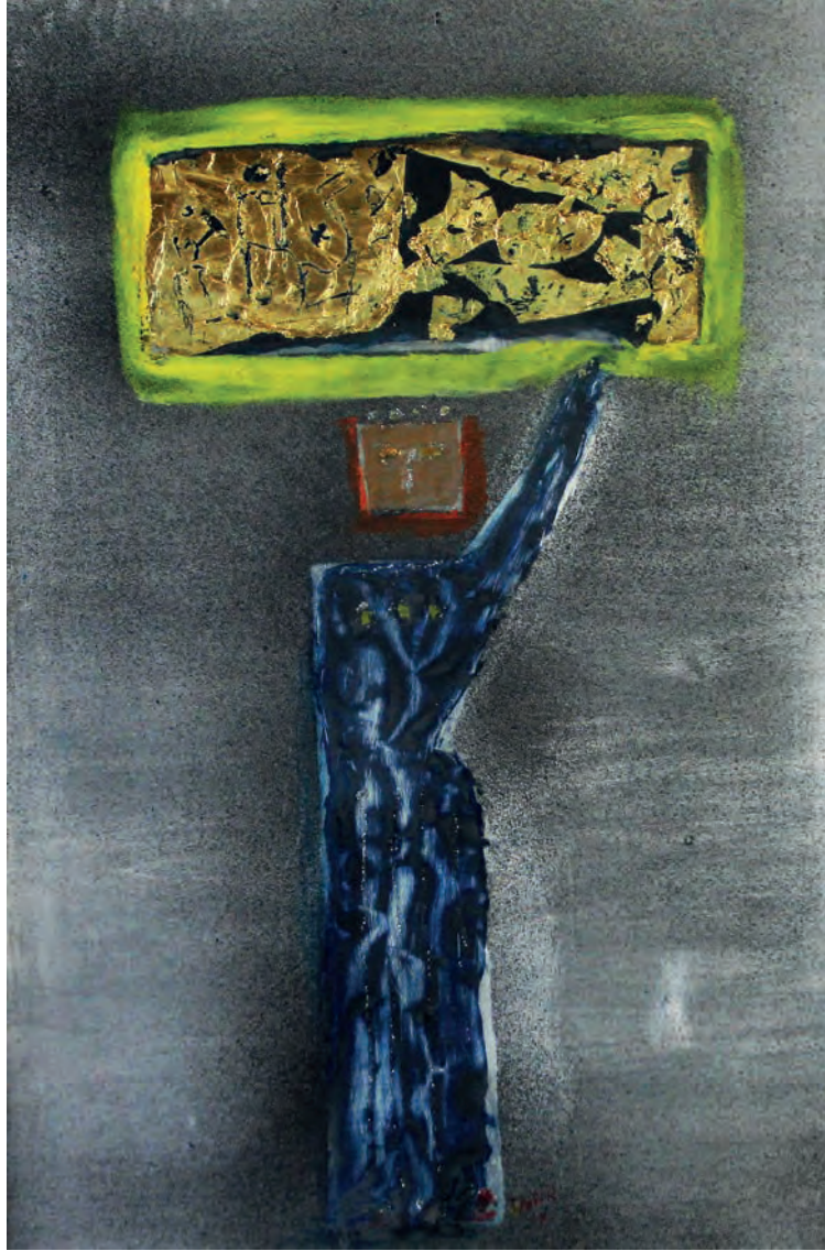
Pankart Metal Üzeri Karışık Teknik, 50x70 cm, 2010