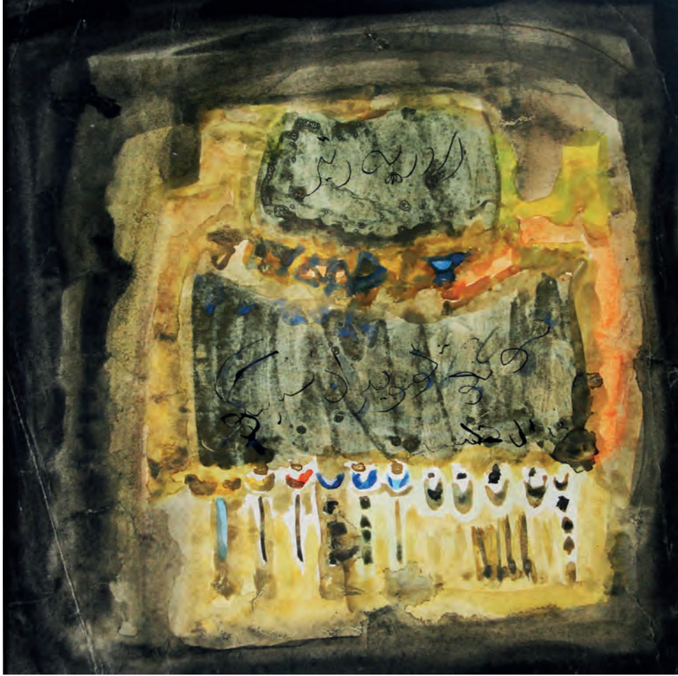
Tarihin Tekerrüü Kağıt Üzeri Karışık Teknik, 44x44 cm, 1980