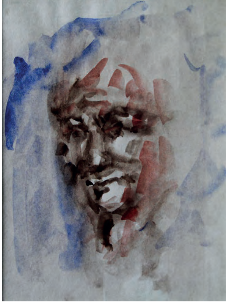
Portre Kağıt Üzeri Suluboya, 23,5x18 cm, 1996