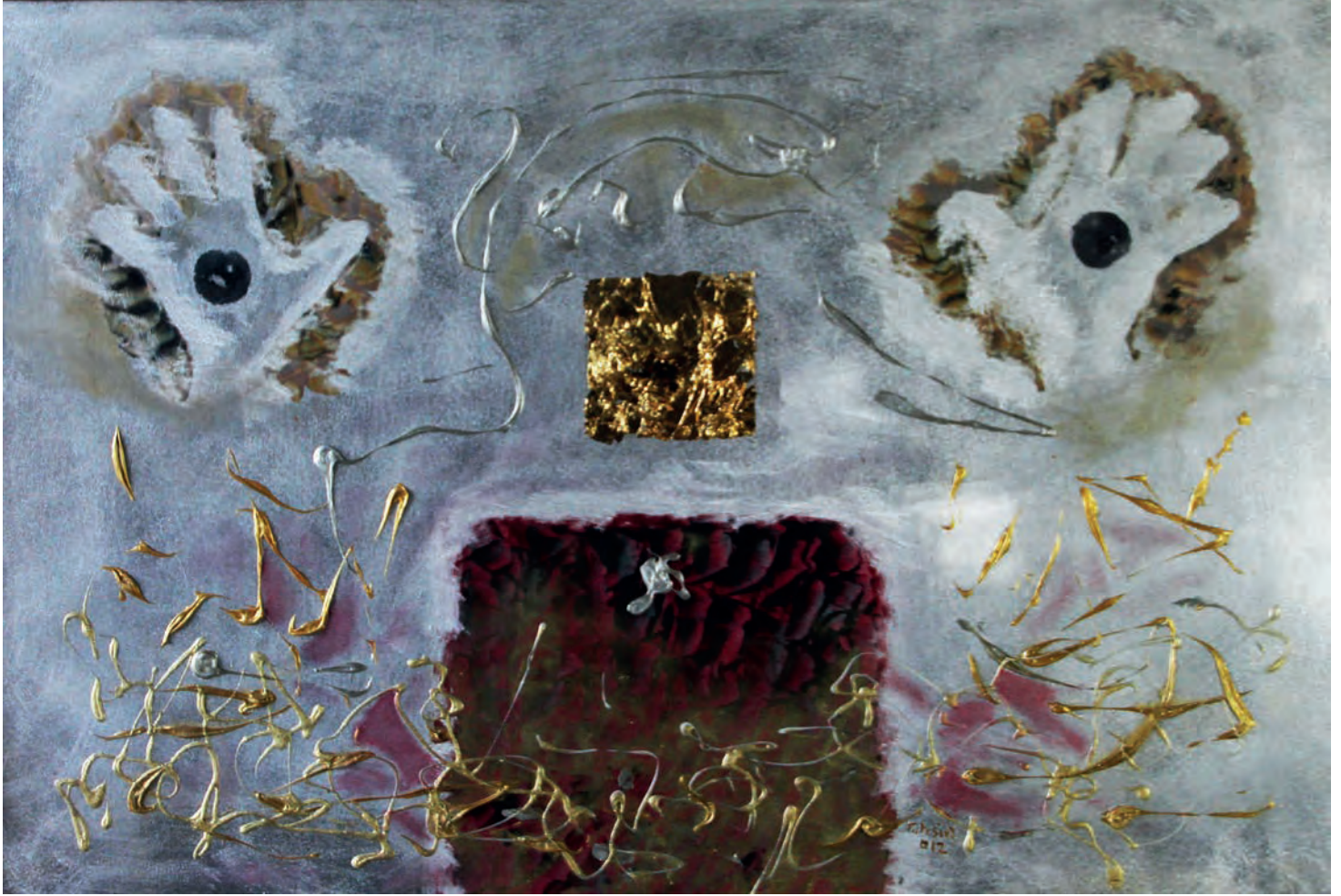
Ellerin Siyah Gözü Metal Üzeri Karışık Teknik, 100x70 cm, 2012