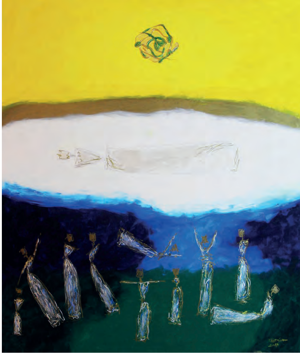
Güneş Yükselen Tuval Üzeri Karışık Teknik, 130x150 cm, 2011