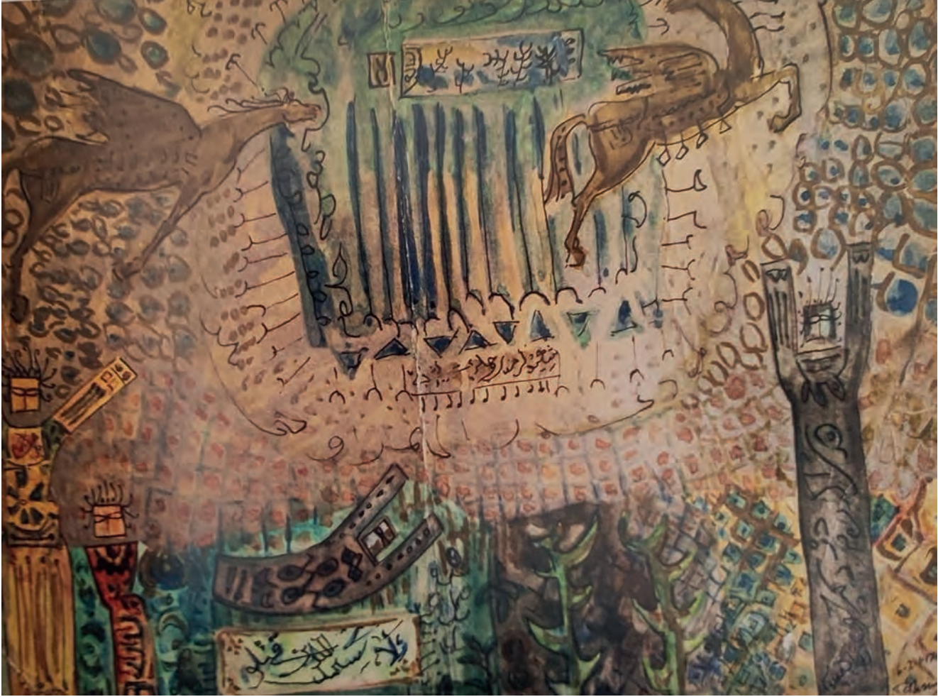
Kerkük Kağıt Üzeri Karışık Teknik, 44x33 cm, 1975