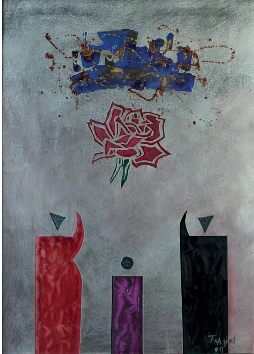
Gül Metal Üzeri Karışık Teknik, 50x70 cm, 2011