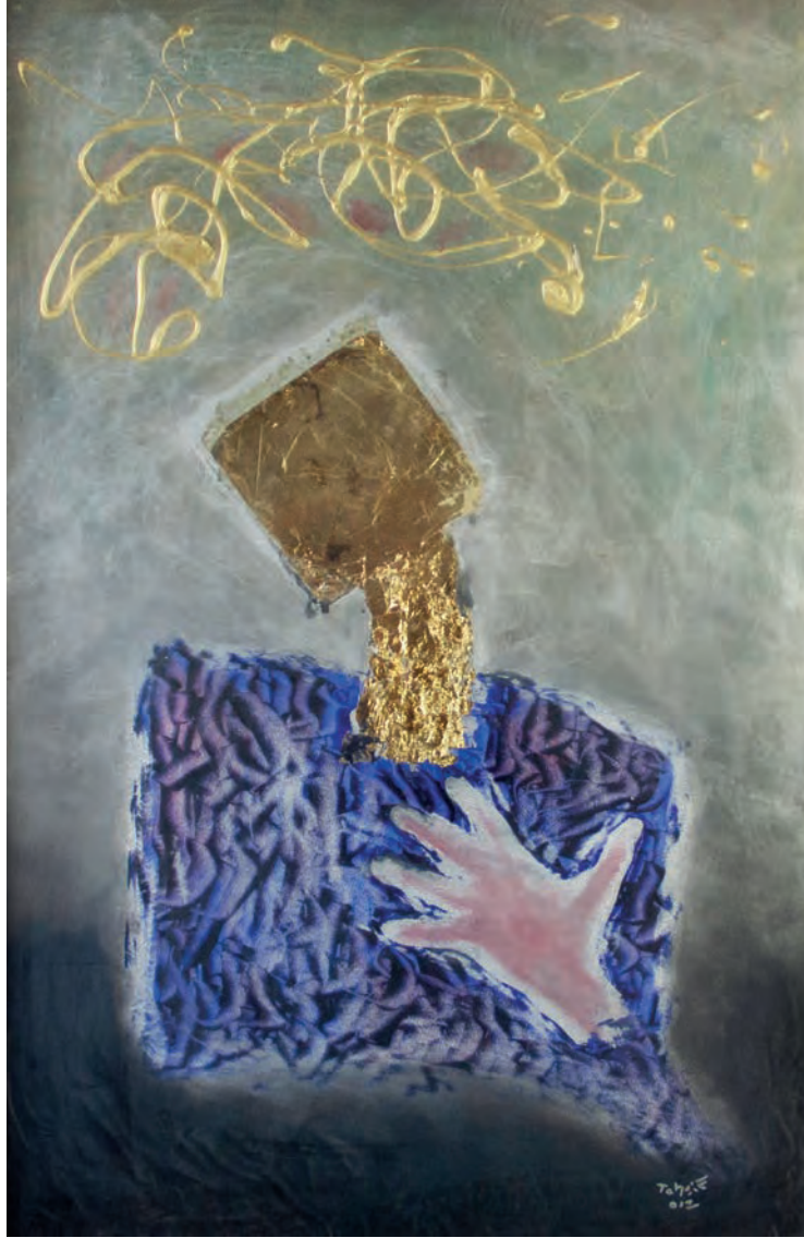
Hasret Metal Üzeri Karışık Teknik, 70x100 cm, 2012