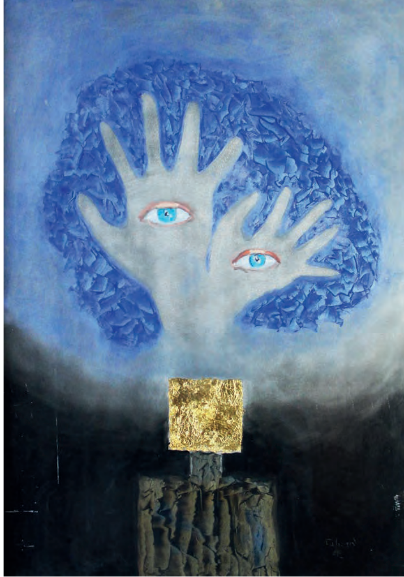
Bakan Eller Metal Üzeri Karışık Teknik, 70x100 cm, 2012