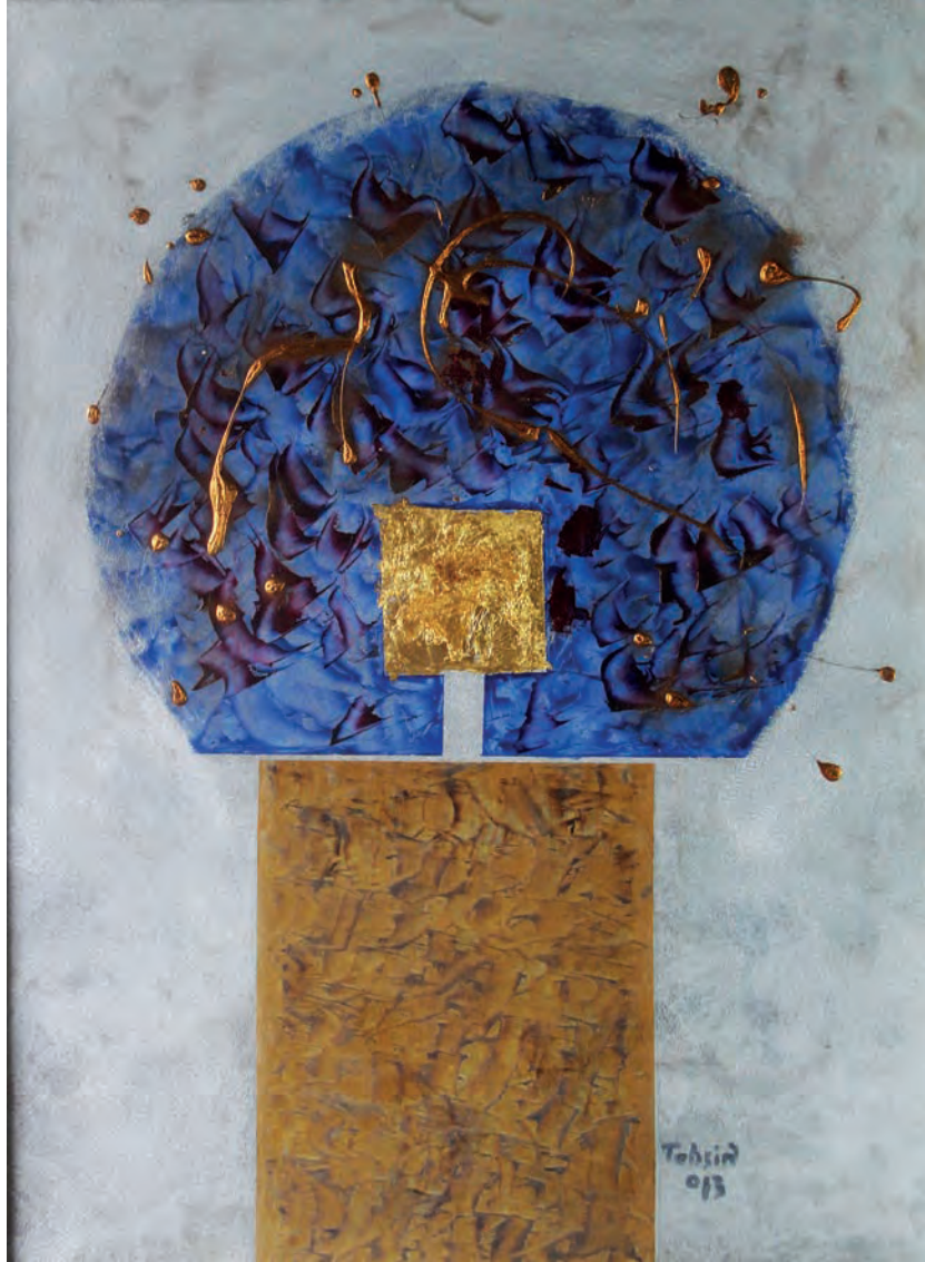
Hale Metal Üzeri Karışık Teknik, 50x70 cm, 2013