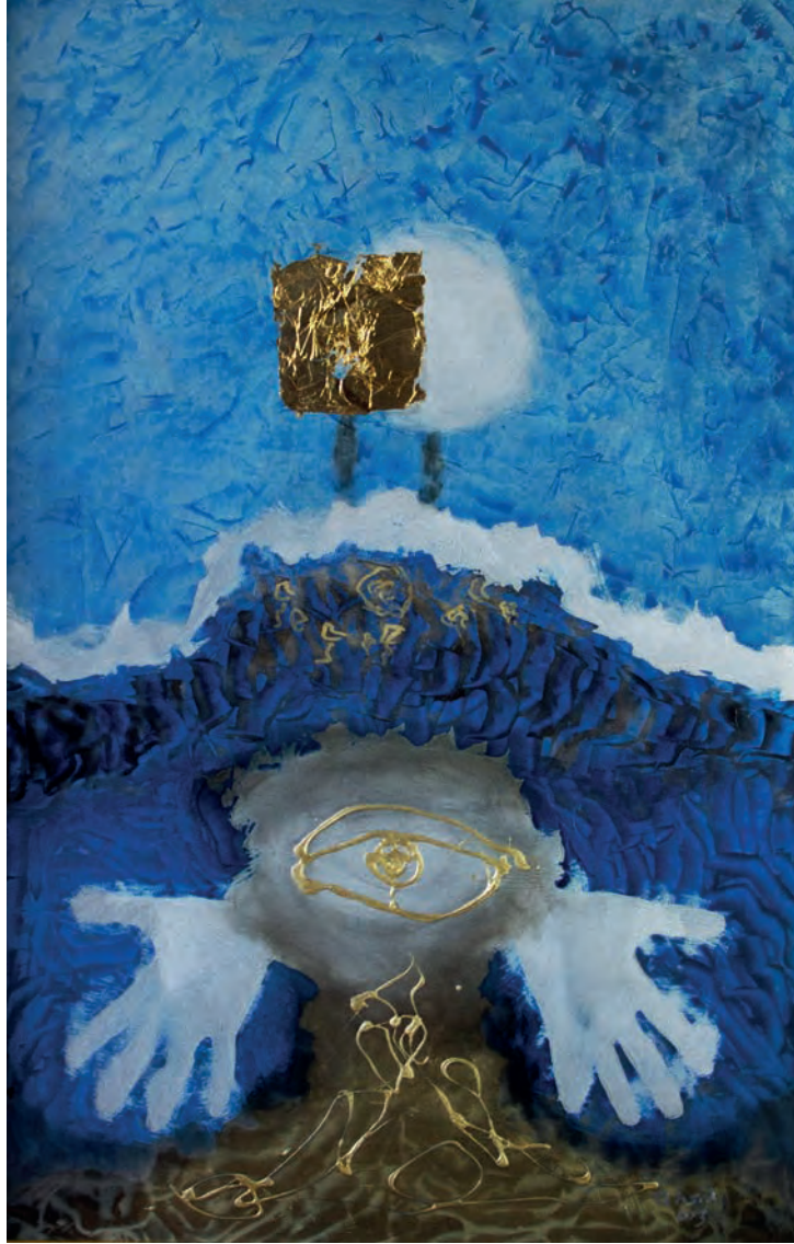
Benim Gözüm Metal Üzeri Karışık Teknik, 50x70 cm, 2012