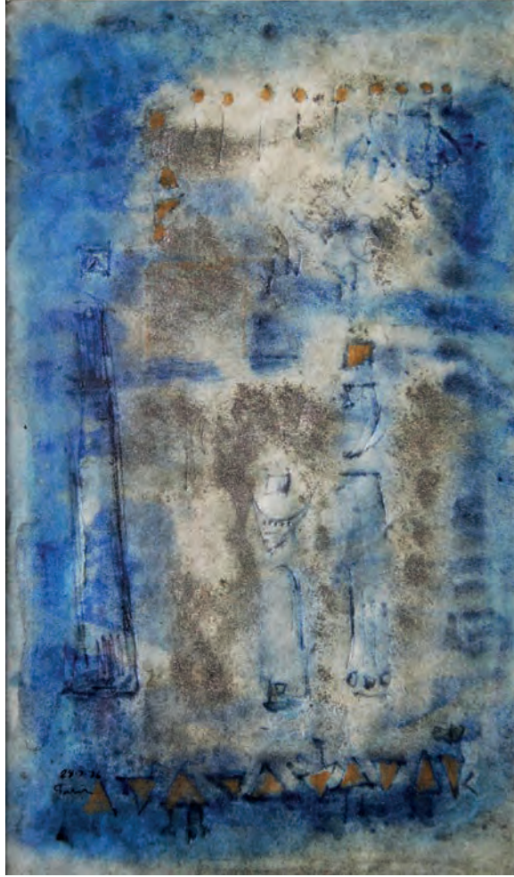
Maviler İinde Kağıt Üzeri Karışık Teknik, 17x29,5 cm, 1976