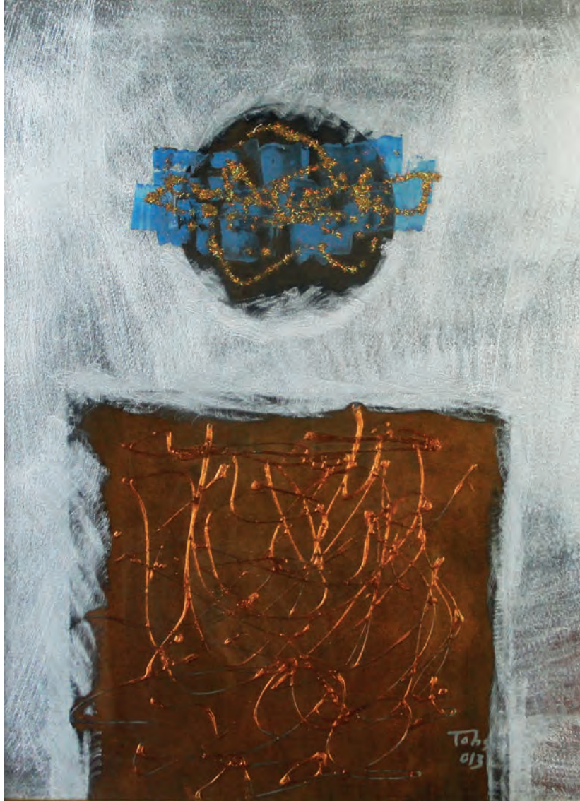
Kırmızılı Gelin Metal Üzeri Karışık Teknik, 50x70 cm, 2013