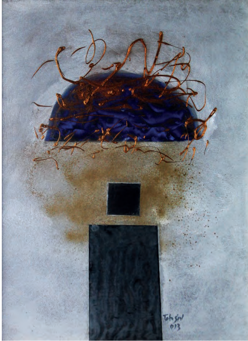
Hale Metal Üzeri Karışık Teknik, 50x70 cm, 2013