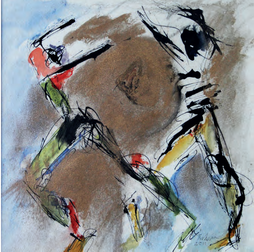
Koşu Kağıt Üzeri Karışık Teknik, 28x28 cm, 2012