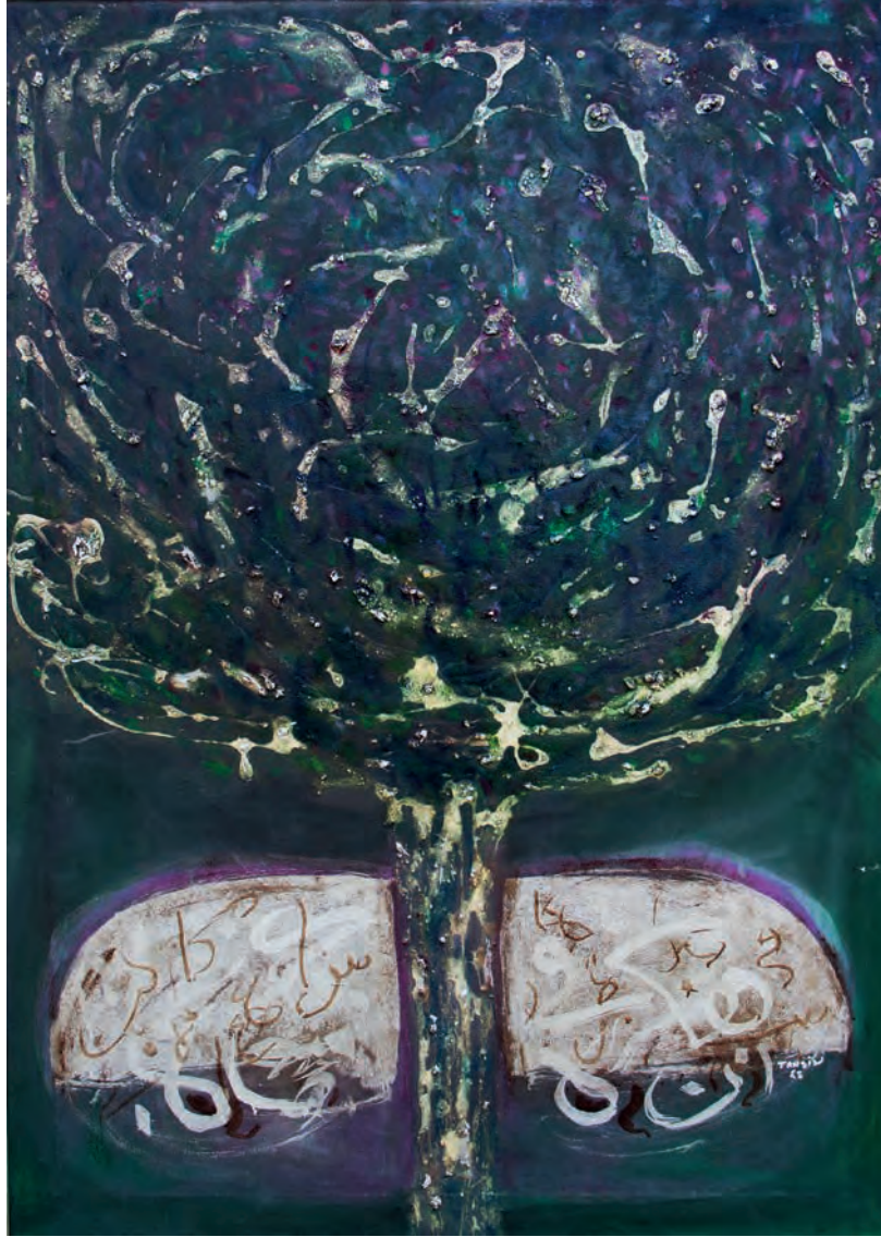
Doğuş Tuval Üzeri Karışık Teknik, 81x116 cm, 1988