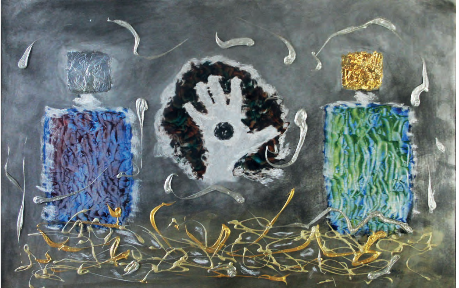
Orta El Metal Üzeri Karışık Teknik, 100x70 cm, 2012