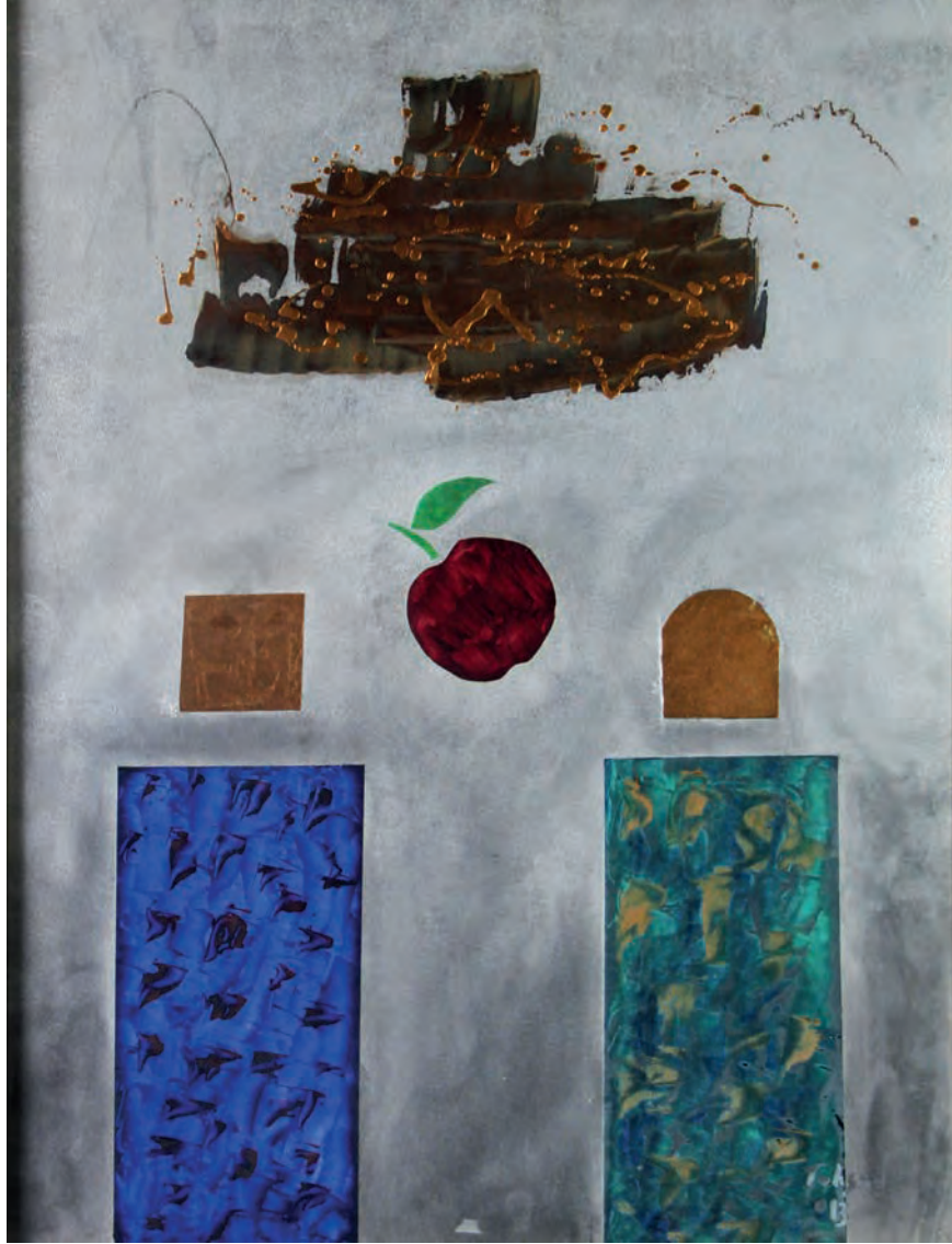
Kızıl Elma Metal Üzeri Karışık Teknik, 50x70 cm, 2012