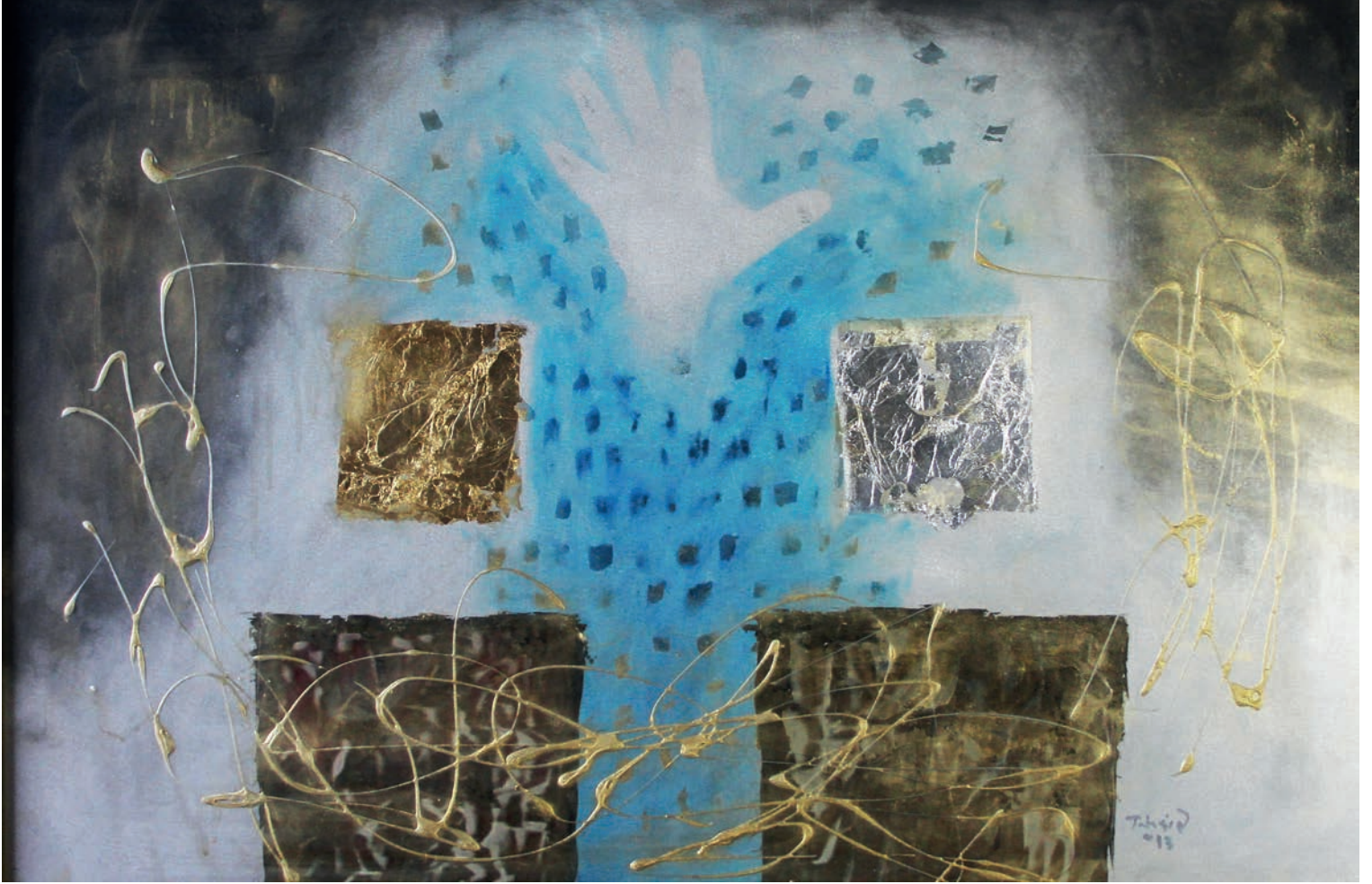
Yeter Artık Metal Üzeri Karışık Teknik, 100x70 cm, 2013