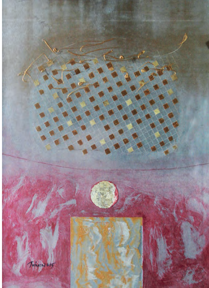
Gökyüzünde Yazılar Metal Üzeri Karışık Teknik, 50x70 cm, 2015