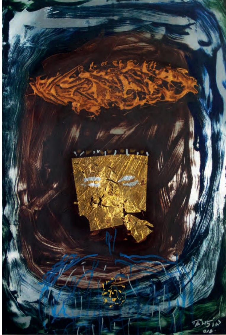
Fırtına Metal Üzeri Karışık Teknik, 50x70 cm, 2012