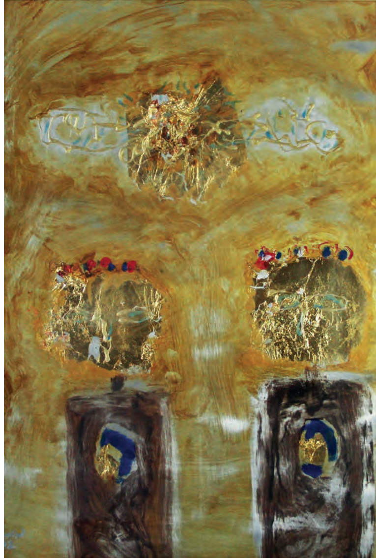
Nazar Boncuğu Metal Üzeri Karışık Teknik, 50x70 cm, 2012