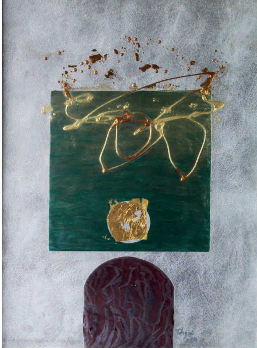
Yeşil Üzerine Yazı Metal Üzeri Karışık Teknik, 50x70 cm, 2014