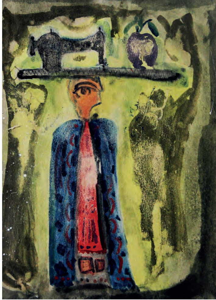
Yağmur Duası Tuval Üzeri Karışık Teknik, 22x25 cm, 1975