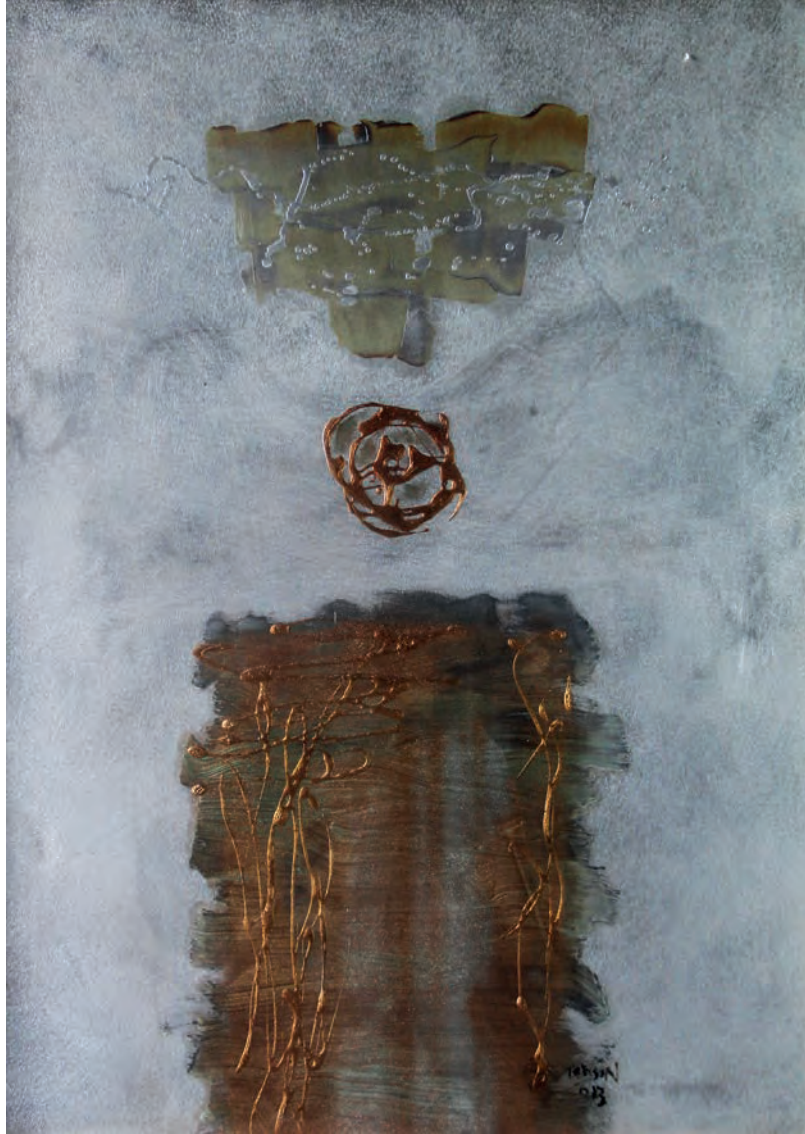
Benim İnsanım Metal Üzeri Karışık Teknik, 50x70 cm, 2013