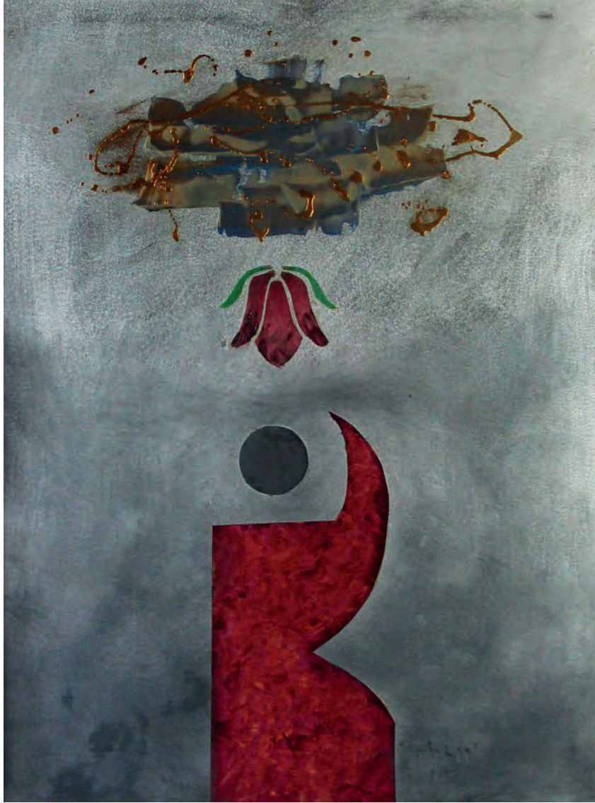
Lale Metal Üzeri Karışık Teknik, 50x70 cm, 2011