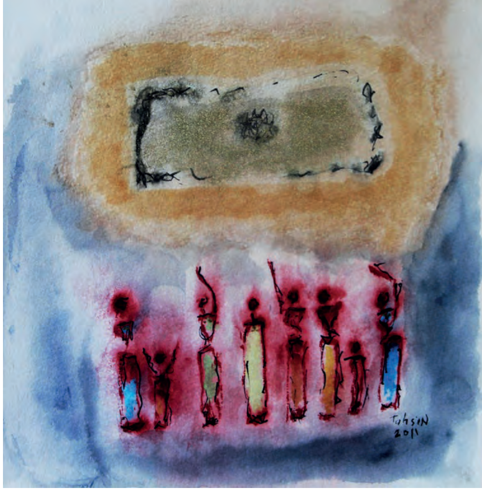
Yakarış Kağıt Üzeri Karışık Teknik, 25x25 cm, 2011