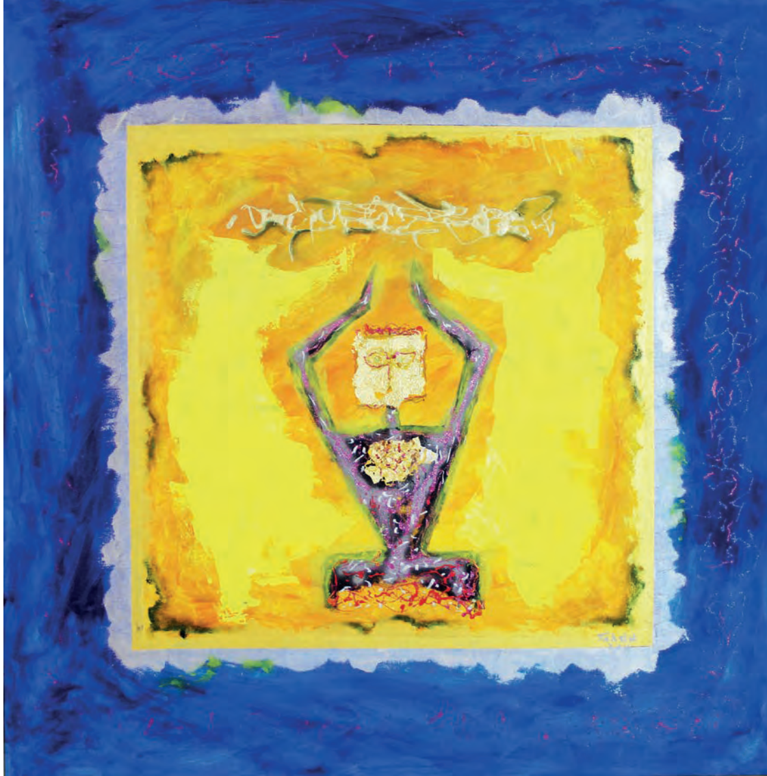
Çengi Tuval Üzeri Karışık Teknik, 100x100 cm, 2011