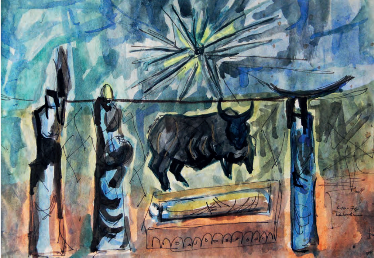
Boğa Kağıt Üzeri Karışık Teknik, 21x30,5 cm, 1974