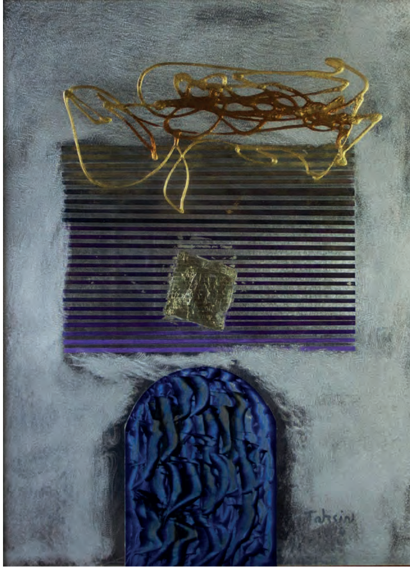
Farklı Bir Bakış Metal Üzeri Karışık Teknik, 50x70 cm, 2014