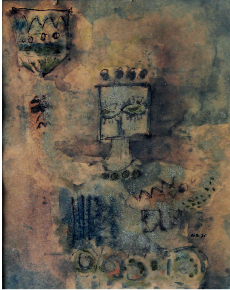
Güz Çiçeğinin Dikişi Kağıt Üzeri Karışık Teknik, 30x43 cm, 1975