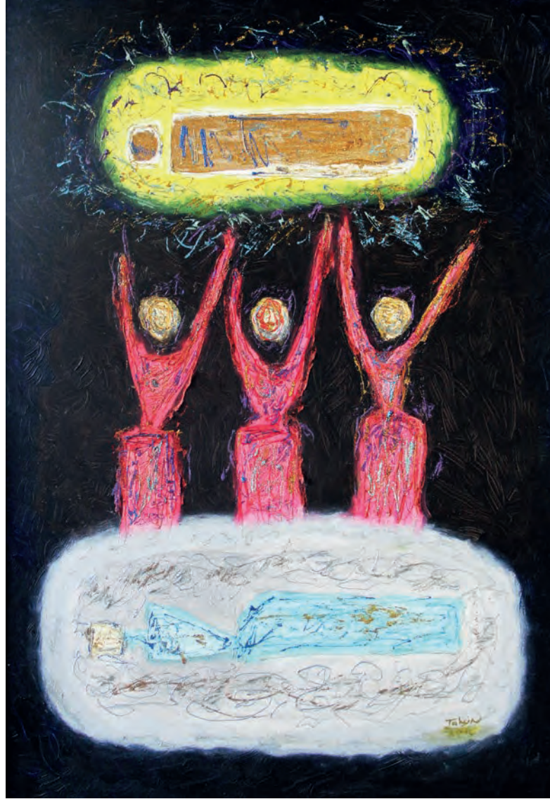
Hayat Döngüsü Tuval Üzeri Karışık Teknik, 70x100 cm, 2010