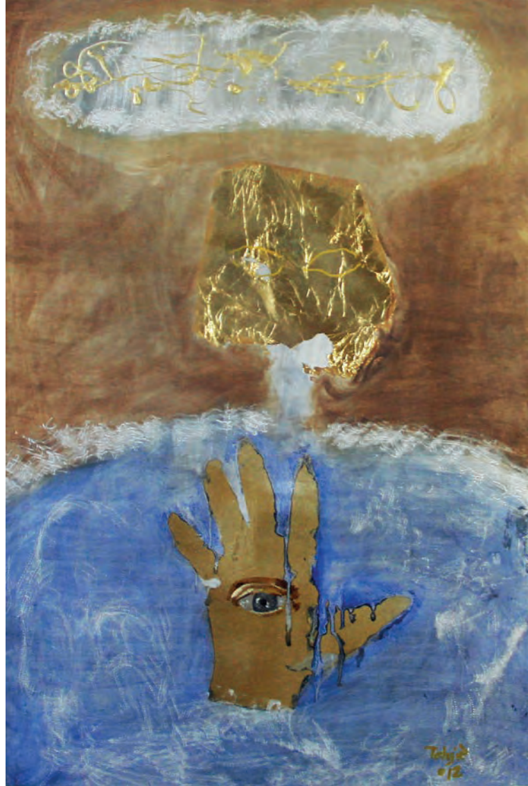
Gözyaşı Metal Üzeri Karışık Teknik, 50x70 cm, 2012