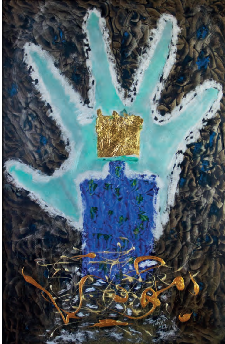
Aklımın İinde Metal Üzeri Karışık Teknik, 70x100 cm, 2012